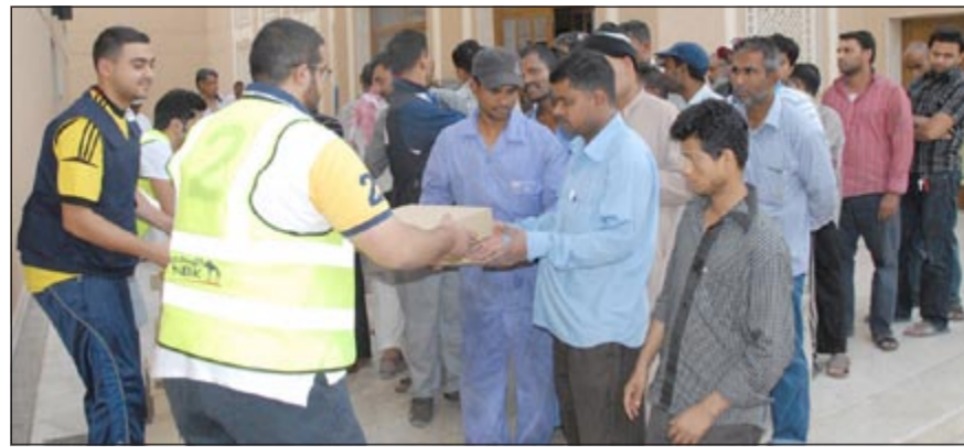
فريق العلاقات العامة لدى بنك الكويت الوطني خلال توزيع وجبات الإفطار على الصائمين في أحد المساجد

وتوفر شركة VIVA خدماتها التي تثرى تجربة العملاء وتمنحهم أجواء رمضان ودينامية مبهجة تعزز المشاعر الروحية، عن طريق الرسائل النصية القصيرة SMS والرسائل المتعددة الوسائط MMS وبرامج الهواتف الذكية ووسائل الترفيه التفاعلية في مختلف المجالات. وتشمل الخدمات مقاطع من آيات من الذكر الحكيم ومجموعة من نعمات الاتصال التي تدور حول فضائل شهر رمضان المبارك. وتطرح شركة VIVA خدمة الشيخ عائض القرني التي تقدم نصائح دينية تتعلق بنمط الحياة الدينية للمسلم، وبرنامج العجيري التي تشمل إمسائية رمضان لمواقبت الإفطار والسحور، وخدمة العفاسي للآيات والأدعية فضلا عن خدمة معجزات القرآن التي تحتوي على مئات من المعلومات العلمية والمعجزات المتواجدة في القرآن الكريم، وغيرها من الخدمات الدينية التي لتي