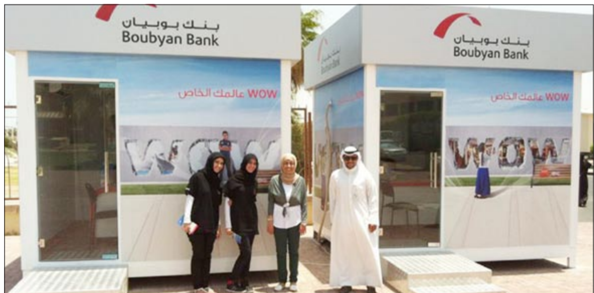
جناح البنك المميز في الجامعة

يستحق الطالب في نهايته على مكافأة مالية وشهادة تقديرية. وإلى جانب ما يقدمه البنك من خدمات مميزة للشباب فإنه يوليهم اهتماما خاصا سواء خلال الاهتمام بالمنتجات والخدمات المميزة التي يقدمها لهم أو من خلال دعمه المستمر لهم في إطار مسؤوليته الاجتماعية حيث قام خلال الفترة الاخيرة بدعم الكثير من مشروعاتهم ومعارضهم وفعاليتهم.