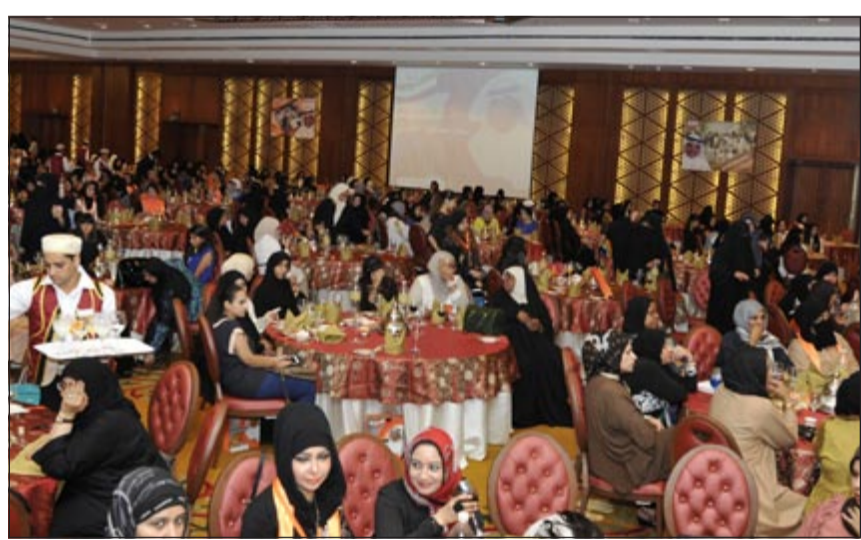
ناخبات الدائرة الثالثة يستمعن إلى كلمة صاهود (هاني عبدالله)