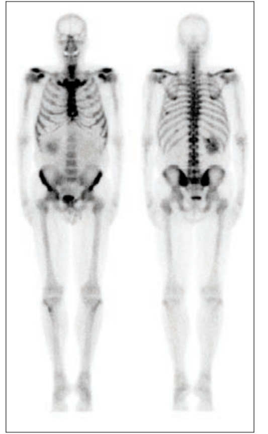
المسح الإشعاعي الكلي للعظام

وغيره بالذكر أن فحص تصوير العظام بالنظائر المشعة يمتاز بالكشف المبكر لأمراض العظام مقارنة بفحوصات الأشعة الأخرى، وذلك لإمكانية تشخيص التغييرات الحاصلة في العظام فور حدوثها. ويتم في هذا