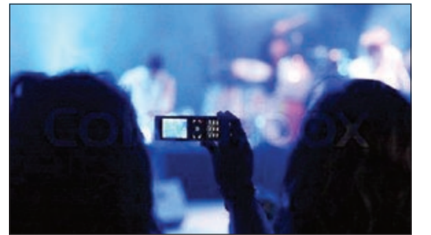
تصوير الحفلات يزج الفنانين