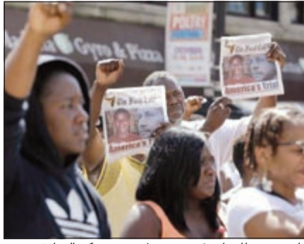
جانب من تظاهرات في نيويورك تندد بحكم البراءة