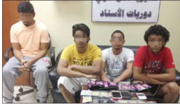
المتهمون الاربعة وامامهم كميات المخدرات المضبوطة

ومدير إدارة العمليات العقيد ناصر العدواني اشتبهت في مركبة نوع أوريون بها 4 شبان ولدى توقيف المركبة بدا على الشباب الأربعة وهم كويتيان من مواليد 1992 و1993، ومصريان من مواليد 1995 و1996، الارتباك الشديد ويبدون في حالة غير طبيعية، وعليه تم تفتيشهم احترازا وتفتيش المركبة التي كانوا يستقلونها، وأسفرت عملية التفتيش عن ضبط 31 كيس تبغ مخلوط بمادة المارغوانا و39 كيسا أخرى منها مادة مخدرة غير معلومة