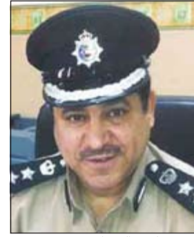
العقيد ناصر العدواني