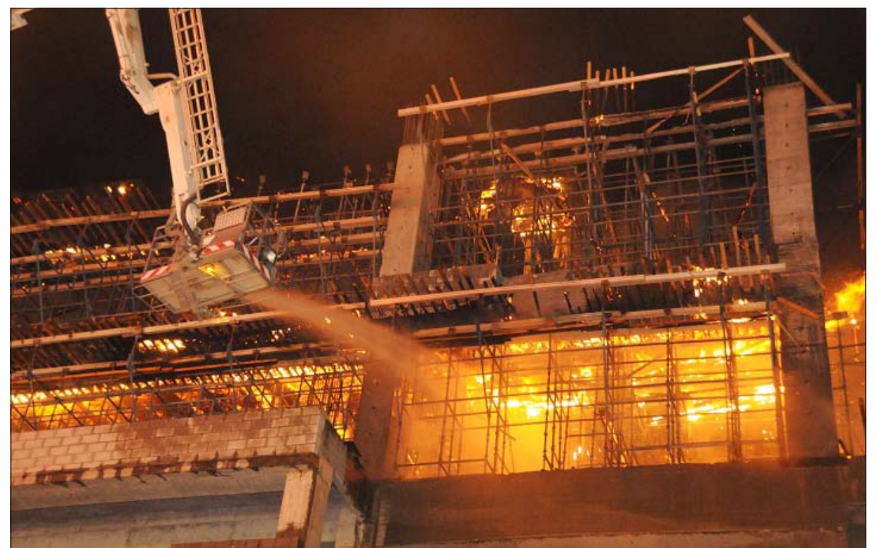
النيران التهمت اخشاب ومواد بناء في المبنى

اندلع حريق كبير في مجمع قيد الإنشاء يتكون من 5 طوابق في منطقة العقيلة مساء أمس، الاول وقال مدير ادارة العلاقات العامة في الإطفاء العقيد