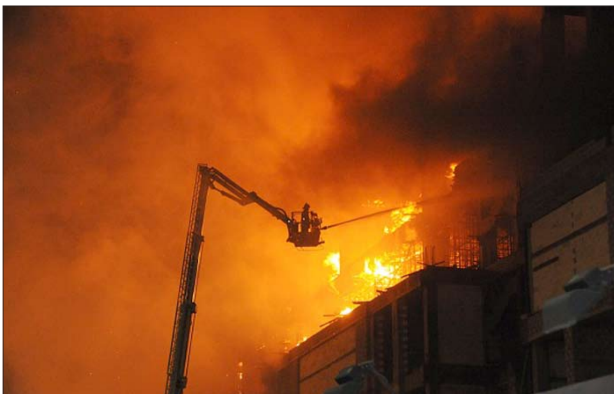
رجال الإطفاء يتعاملون مع الحريق من خلال السلالم المتحركة