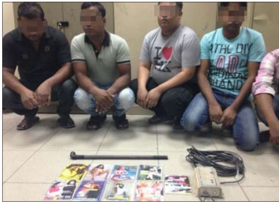
أجهزة فك تشفير وأفلام خليعة عثر عليها مع المتهمين