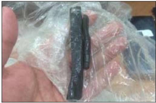
المخدرات المضبوطة في السالمي

أوقف رجال جمارك السالمي مواطنا وضع قطعة حشيش بين طيات ملبسه في محاولة منه لإخفائها الى البلاد لتتم إحالته الى الإدارة العامة لمكافحة المخدرات، وقال مصدر امني ان رجال جمارك السالمي اشتبهوا في شاب كويتي كان في طريق العودة الى البلاد بفترة السحور وبتفتيش سيارة المواطن لم يتم العثور على شيء وما أثار شكوك رجال الجمارك هو ارتباك الشاب الذي اخضع لتفتيش الملابس فوجدت قطعة حشيش في احد جيوب المواطن الذي رفع به تقريرا وتمت إحالته الى جهة الاختصاص.