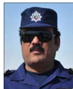
العميد معنوق العسلاوي

تفنيذا لخطة وزارة الداخلية بالحد من ظاهرة التسول التي تزداد في رمضان بشكل مكثف شن رجال أمن الأحمدى وتعليمات من مدير أمن الأحمدى بالإنابة العميد معنوق العسلاوي حملة موسعة في نطاق مناطق المنقف والمهبولة وأبو حليفة وحصدت الحملة 15 متنسولا ومتنسولة بواقع 12 امرأة و3 رجال من الجنسية الباكستانية.