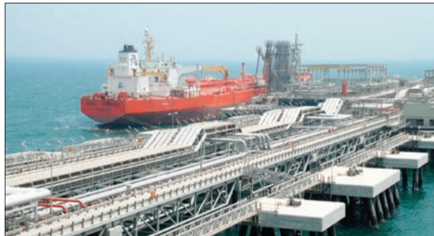
«البترول الوطنية» تستعد لإنشاء مرفق جديدة لاستيراد الغاز

البديل المناسب الآن في ضوء الاحتياجات الكبيرة للكويت وفشل المفاوضات لاستيراد الغاز من الدول المجاورة على أن يتم ضغط الغاز لدى المؤسسة بعد تسلمه من السفن في مصفاة ميناء الأحمدية. وأشار إلى أن الكويت ستستمر في خطين متوازيين لاستيراد الغاز من خلال الاعتماد على الغاز المستخرج من الكويت وهو الأمر الذي ستنتج الرؤية أكثر بالنسبة إليه خلال الفترة المقبلة، وفي الوقت ذاته الاعتماد على الغاز المستورد عبر السفن، إضافة إلى كميات الغاز التي ستصل الكويت فيما بعد وفق نتائج المفاوضات مع قطر وأميركا، مؤكداً على أن احتياجات الكويت من الغاز تتضاعف وهي في حاجة لكل هذه الكميات.