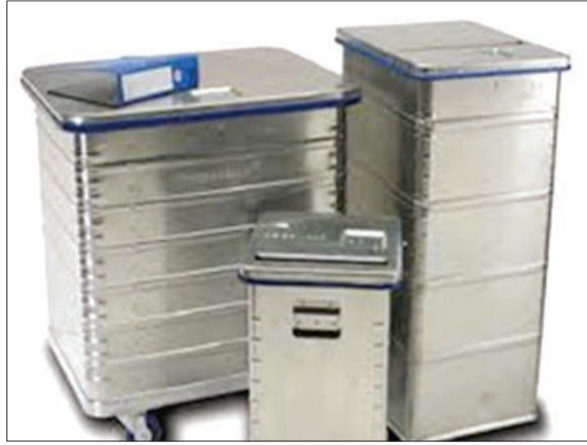
أحدى الحاويات المتطورة

كشفت مصادر مطلعة لـ«الأنباء» عن مفاوضات تجريها حاليا شركة استدامة القابضة مع أحد البنوك المحلية التي تعمل وفق الشريعة الإسلامية لتقديم خدمة التخلص الآمن من الوثائق الورقية والإلكترونية وذلك عبر تأجير البنك مجموعة من الحاويات المتطورة التي تملكها «استدامة القابضة» للتخلص الآمن من الوثائق الورقية والإلكترونية بما فيها الأقراص الصلبة والأقراص المدمجة الموجودة لدى البنك بما يضمن استحالة إعادة تجميعها واستخدامها والحصول على بيانات ومعلومات منها من قبل الجهات غير المصرح لها بذلك مع ضمان الحفاظ على البيئة.