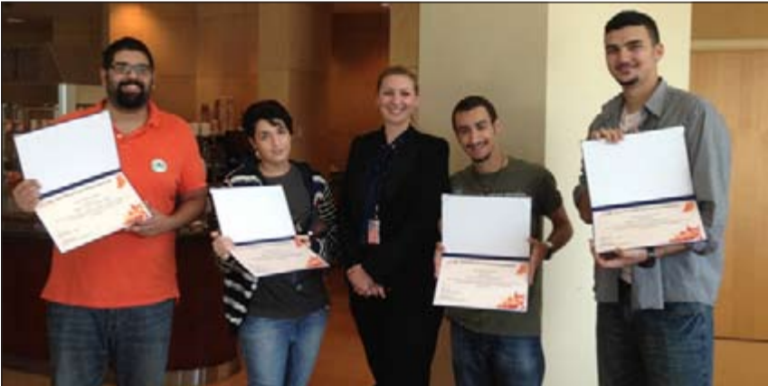
الطلبة المشاركون في المعرض