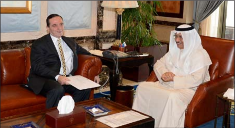
سمو رئيس الوزراء الشيخ جابر المبارك مستقبلاً السفير محمد الكايد

جابر المبارك في قصر السيف أمس سفير المملكة الأردنية الهاشمية الشقيقة لدى الكويت السفير محمد الكايد حيث نقل لسموه رسالة خطية من رئيس وزراء المملكة الأردنية الهاشمية الشقيقة د.عبدالله النسور تناولت العلاقات الثنائية بين البلدين الشقيقين وسبل تعزيزها في شتى المجالات.