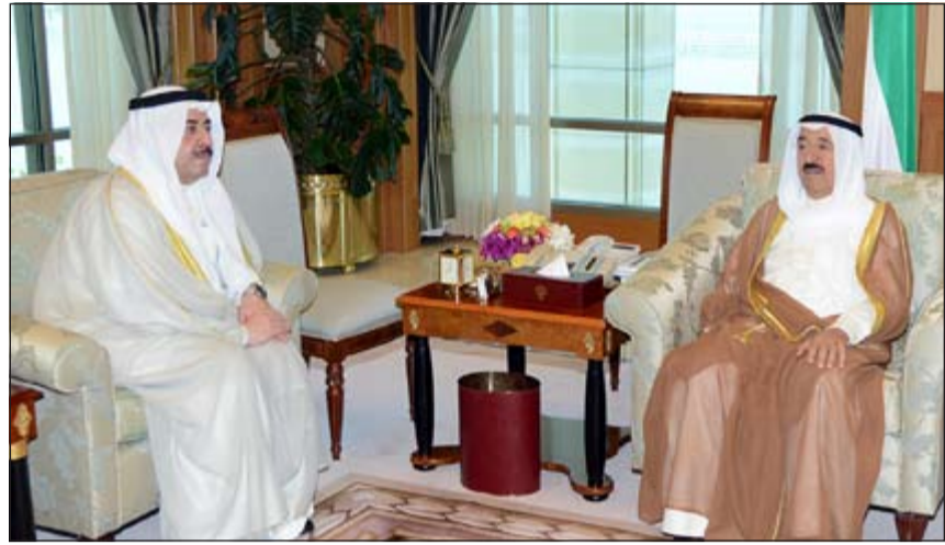
صاحب السمو الامير الشيخ صباح الاحمد مستقبلاً الشيخ احمد الحمود

الصديقة عبر فيها سموه عن خالص تهانئه صباح العيد الوطني، متمنياً له موفور الصحة والعافية والبلد الصديق دوام التقدم والأزدهار. ويبحث سمو ولي العهد الشيخ نواف الاحمد ببرقية تهنئة الى الرئيس فرنسوا هولاند رئيس الجمهورية الفرنسية الصديقة عبر فيها سموه عن خالص تهانئه بمناسبة العيد الوطني لبلاده، متمنياً له موفور الصحة والعافية. كما بعث سمو رئيس مجلس الوزراء الشيخ جابر المبارك ببرقية تهنئة