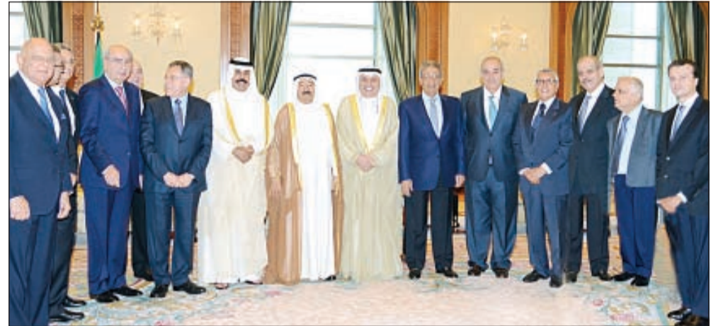
صاحب السمو الأمير الشيخ صباح الأحمد وسمو ولي العهد الشيخ نواف الأحمد في لقطة تذكارية مع رئيس وأعضاء مجلس العلاقات العربية والدولية

عمرو موسى عن مكان مرسي: «معرفش والله إنما من المؤكد أنه في مصر»