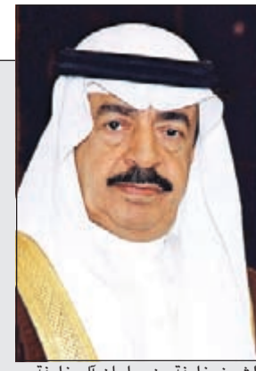
الشيخ خليفة بن سلمان آل خليفة