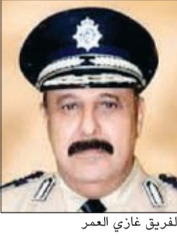
الفريق غازي العمر

قال مصدر أمنى إن وكيل وزارة الداخلية الفريق غازي العمر أبقى إلى الوكلاء المساعدين وكبار قيادات وزارة الداخلية للتشرف بتهنئة صاحب السمو الأمير الشيخ صباح الأحمد وآل الصباح الكرام بحلول شهر رمضان، حيث تم عمل الترتيبات الخاصة بهذه المناسبة السنوية. وأشار المصدر إلى أن الفريق العمر طلب من قيادات الوزارة في البرقية التي تم تعميمها ارتداء الزي الرسمي، مشيراً إلى أن العمر وفي مبادرة لافتة طلب من كبار قيادات وزارة الداخلية المتقاعدين المشاركة في السلام على صاحب السمو وأبناء الأسرة الحاكمة.