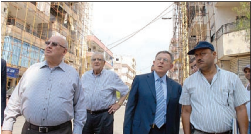
رئيس كتلة المستقبل النيابية فؤاد السنيورة يتفقد أعمال الترميم لأضرار أحداث منطقة عبرا في صيدا (محمود الطويل)