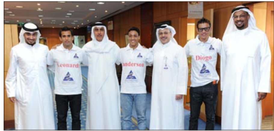
فريق «الكويتية للاستثمار»

أعلنت الشركة الكويتية للاستثمار عن مشاركتها للفترة الرابعة على التوالي في دورة الروضان وعدد آخر من دورات كرة قدم الصالات التي تنظم خلال شهر رمضان الفضيل، وذلك مع انطلاق دورة المرحوم عبدالله مشاري الروضان لكرة الصالات في نسختها الـ34 وذلك تحت رعاية صاحب السمو الأمير حفظه الله ورعاها. ويضم فريق الكويتية للاستثمار ثلاثة لاعبين برازيليين محترفين هم ديبغو مينيركو تيروزيني وفاندير سون إيوستاكوبو نيوموسينو وليوناردو سيلفا سانتانا. وسوف يتنافس فريق الكويتية للاستثمار مع قرابة 40 فريقاً محلياً وخارجياً في منافسة تستمر حتى 28 من شهر رمضان المبارك على ملعب صالة الشهيدي فهد الأحمد الصباح في منطقة الدعية. ويتوقع للفريق أن يحصل على ترتيب متقدم في الدورة نظراً لما يتمتع به من قوة وتميز لاعبيه البرازيليين وقدراتهم الفنية الكبيرة. كما تحرص الشركة على توفير كل امکانيات اللاعبة للفريق لتحقيق أفضل النتائج وأعلى المراكز ورفع اسم الكويتية للاستثمار لدى جمهور