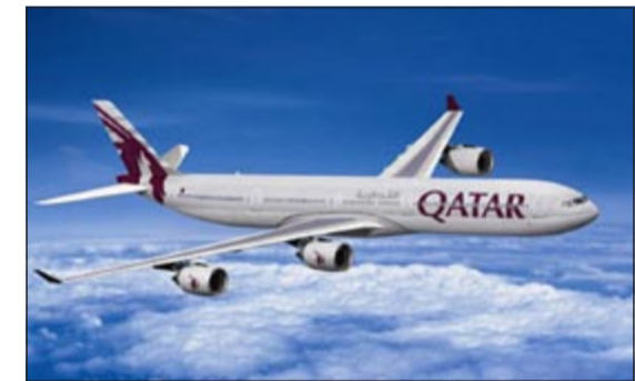
الخطوط الجوية القطرية

أن تقدم لمسافرينا خدمات مميزة تلبي احتياجاتهم وتتل استحقاقهم». ويقدم طاقم ضيافة القطرية هذه الوجبات للركاب الصائمين غير الراغبين بتناول الوجبات العادية المسافرين في درجة رجال الأعمال والدرجة السياحية على متن الرحلات بين الدوحة وعدة دول في منطقة الخليج والشرق الأوسط وبلاد الشام من بينها: أبو ظبي، الإسكندرية، الجزائر، عمان، بغداد، البحرين، الكويت، دبي، أربيل، إسطنبول، جدة، الخرطوم، الكويت، والمدينة المنورة، مشهد، سقط، النجف، الرياض، صنعاء، وطهران. وتسير القطرية اليوم