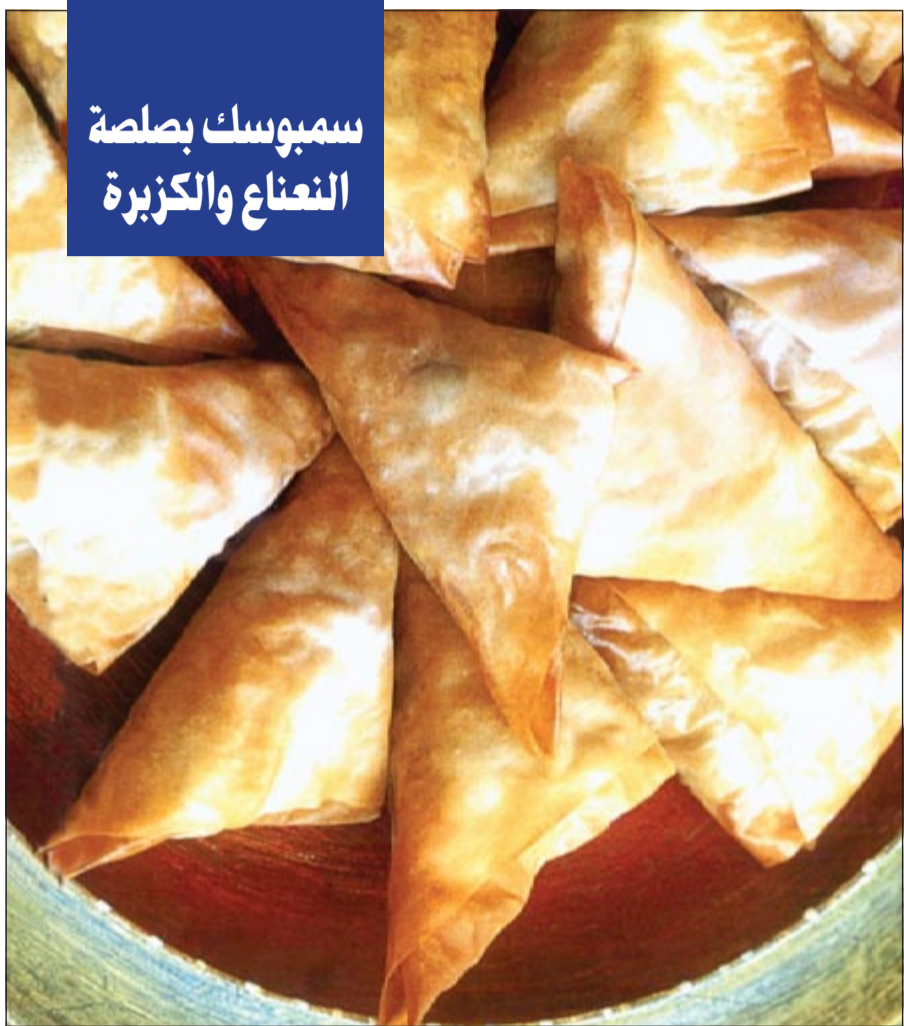
سمبوسك بصلصة النعناع والكزبرة