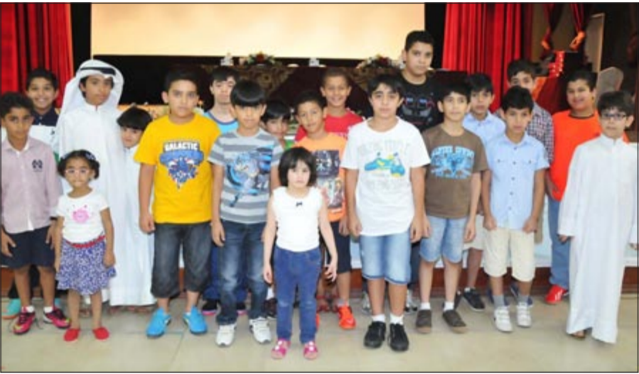
عدد من المتفوقين والمتفوقات المكرمين

متابعته في جميع المراحل ستجني ثمار ما زرعت، إضافة إلى الوالدين والأسرة التي بذلت جهودا كبيرة طيلة سنوات التحصيل والتعليم، فالجهود التي تبذلها المؤسسات التعليمية والتعاونية تعود بخيرها على الوطن كله.