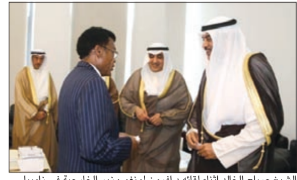
الشيخ صباح الخالد أثناء لقائه دافرون لونغو وزير الخارجية في زامبيا

تمويل المشاريع فإن الصندوق الكويتي قدم كذلك المساعدات الفنية لبعض الدول الأعضاء في الـ «سادك»، من خلال تمويل دراسات الجدوى والتحضيرات لمشاريع مختلفة. ولعلي أستعمر هذه الفرصة لأجدد التأكيد على التزامنا بالمرزب من التعاون مع الدول الأعضاء في الـ «سادك»، والمساهمة في الجهود الساعية إلى تحقيق الطموحات والأهداف التنموية. الحضور الكريم نحن نؤمن بأن هناك العديد من القنوات لتعزيز التعاون العربي - الأفريقي ولهذه الغاية فإن الكويت تشرف باستضافة القمة العربية - الأفريقية الثالثة خلال الفترة من 18 إلى 20 نوفمبر 2013. كما أننا في تواصل مستمر مع الاتحاد الأفريقي وجامعة الدول العربية بهدف تحقيق الأهداف المنقذ عليها تحت شعار القمة «شركاء في التنمية والاستثمار» بما يسهم في تعزيز التعاون جنوب - جنوب. وبهدف التأكيد على الروابط الثقافية والإنسانية المتعددة بين القارة الأفريقية والدول الأعضاء في جامعة الدول العربية فإن القمة ستضم عددًا من الأنشطة الثقافية بما يسلط الضوء على الإرث العربي - الأفريقي العريق. علاوة على ذلك ويهدف تعزيز التعاون الاقتصادي بين الإقليم العربي والأفريقي فإن الصندوق الكويتي يصدد تنظيم منتدى اقتصادي عربي - أفريقي على هامش أعمال القمة بما يمكن أعضاء ممثلي القطاع الخاص والمنظمات غير الحكومية والخبراء في مجالات التمويل والصناعة والتجارة من مناقشة مواضيع متنوعة تتعلق بتدفق الاستثمار العربي - الأفريقي البيئي وتعزيز التعاون وحماية وضمان الاستثمار والتبادل التجاري بين الإقليم وكذلك التنمية الزراعية والأمن الغذائي. أصحاب المعالي وفي