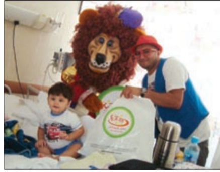
توزيع الهدايا على الأطفال

نظمت شركة طفل المستقبل الترفيهية العقارية (فيوتشر كيد) فعاليات برنامج حفل ترفيهي لرعاية أطفال مستشفى مبارك ومشاركتهم فرحة الاحتفال بحلول شهر رمضان الكريم وذلك في إطار المسؤولية الاجتماعية للشركة التي تعتبر جزءا من ثقافتها الممتدة على مدار أعوام في خدمة المجتمع.