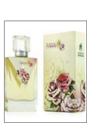
عطر فرح الجعيد