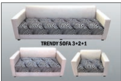
TRENDY SOFA 3+2+1