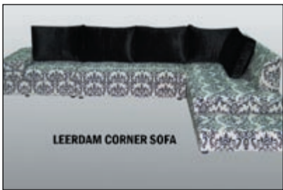
LEERDAM CORNER SOFA