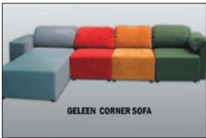
GELEEN CORNER SOFA