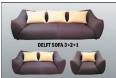
DELFT SOFA 3+2+1

واختيار السوان الخامات والقماش الذي يرغب فيه من تشكيلة واسعة من أجود الخامات المستوردة، أما بالنسبة للصوصا والديوانيات فهي محلية الصنع بنسبة 100% مع وجود كفالة لمدة 3 سنوات على الخشب والاسفنج، ولما كانت شركة ترندا للأثاث والمفروشات تستهدف جميع شرائح معرض الشركة بالضجيج على الدائري السادس مباشرة وعلى مساحة 11000 متر في ثلاثة ادوار بتوفير كافة احتياجات المنزل، وتوفير البدائل المناسبة بما يتماشى مع المساحة المتوفرة في منزلك. واعلنت ترندا عن توافر مجموعة جديدة ومتميزة من اطقم الجلوس والصوصا بالإضافة الى الديوانيات والتي تلبي كافة الانواق والريجات، حيث توجد عدة تصاميم تناسب كافة الانواق والريجات ويمكن للعميل اختيار الموديل المناسب لتلك المساحة كالدبوانية أو الصالون مثلا.