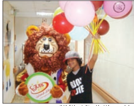
هدايا من «طفل المستقبل» للأطفال

تزامنا مع قدوم شهر رمضان الكريم وما يحمله من خير وبركات اعلنت شركة ترندا للأثاث والمفروشات عن بدء حملتها التسويقية تحت عنوان " رمضانك أحلى مع عروض ترندا"، حيث قامت شركة ترندا للأثاث والمفروشات من خلال معرض الشركة بالضجيج على الدائري السادس مباشرة وعلى مساحة 11000 متر في ثلاثة ادوار بتوفير كافة احتياجات المنزل، وتوفير البدائل المناسبة بما يتماشى مع المساحة المتوفرة في منزلك. واعلنت ترندا عن توافر مجموعة جديدة ومتميزة من اطقم الجلوس والصوصا بالإضافة الى الديوانيات والتي تلبي كافة الانواق والريجات، حيث توجد عدة تصاميم تناسب كافة الانواق والريجات ويمكن للعميل اختيار الموديل المناسب لتلك المساحة كالدبوانية أو الصالون مثلا.