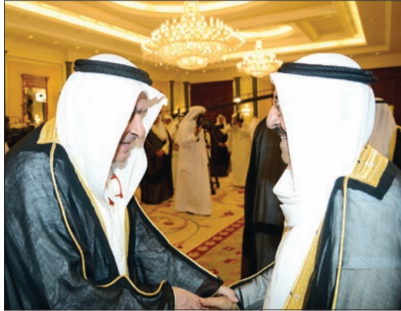
سمو الأمير يتلقى التهاني من محمد الصقر