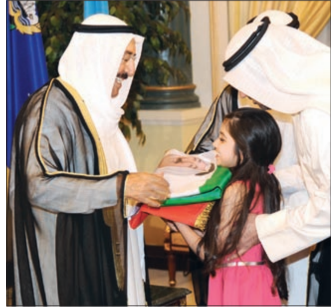
صاحب السمو الأمير الشيخ صباح الأحمد يتسلم علم الكويت عليه صورة سموه من إحدى الزهرات

استمرار توافد المهنيين على ديوان أسرة آل الصباح يؤكد روح الأسرة الواحدة والتواصل والتوحد بين أطراف المجتمع الكويتي كافة