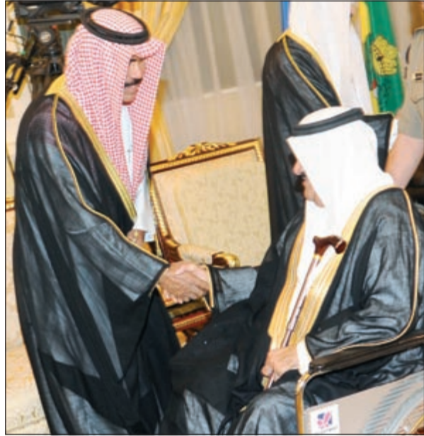
سمو ولي العهد الشيخ نواف الأحمد يتلقى التهاني بحلول رمضان

فيما أشاد سكرتير عام الأمم المتحدة بان كي مون بما وصفه بحنكة القيادتين الكويتية والعراقية على ما أحرز من «تقدم ملحوظ» نحو التطبيع الكامل للعلاقات بين البلدين، رحب باعتماد مجلس الأمن القرار 2107 الشهر الماضي الذي عهد بقضية المفقودين الكويتيين وراعيها البلدان الأخرى والمتسلكات الكويتية لبعثة «يونامي» بموجب الفصل السادس من ميثاق الأمم المتحدة. ولفت إلى أنه لا يزال لدى العراق عدد من الالتزامات عليه الوفاء بها قبل خروجها من إطار الفصل السابع الذي يهدد العراق بعقوبات وعمل عسكري محتمل إذا لم يلتزم بها إلى جانب مواصلة دفع نحو 11 مليار دولار للكويت حتى عام 2015 تعويضاً عن الأضرار التي سببها الغزو. وفيما يتعلق بعلاقة العراق بجيرانه، قال السكرتير العام: أصبح من الواضح بشكل متزايد أنه لا يمكن فصل الأحداث في المنطقة، مشيراً على وجه التحديد بكثير من القلق إلى تأثير الصراع المأساوي في سورية على الدول المجاورة ومن بينها العراق.