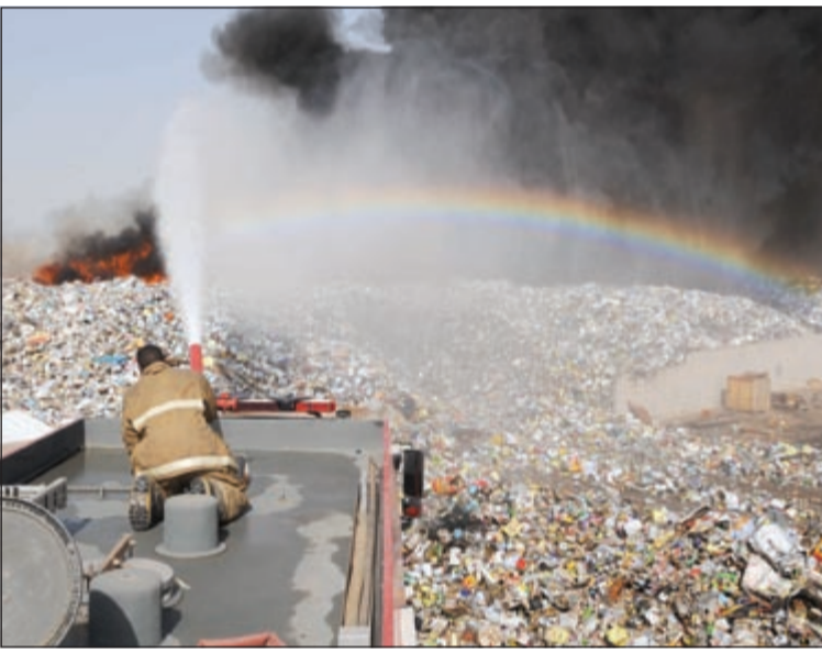
أحد رجال الإطفاء يكافح النيران المشتعلة في أمغرة (هاني الشمري)

5 مراكز إطفاء أخدمت أسنة اللهب في غضون ساعة أمغرة تشتعل في رمضان وانفجارات لعبوات غازية على مساحة 6 آلاف متر مربع