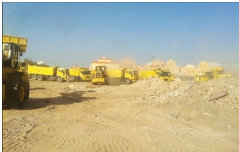
جانب من العمل في الحملة

المحافظة على البيئة. وعلى صعيد متصل جددت إدارة العلاقات العامة بالبلدية دعوتها للجمهور الكريم بالتعاون مع جهاز البلدية وذلك من خلال الاتصال على خط البلدية الساخن 139 الذي يعمل على مدار الساعة وذلك للإبلاغ عن أي شكاوى تتعلق بالبلدية سواء في مجالات الأغذية، النظافة العامة، الباعة المتجولين أو عند ملاحظتهم لأي عمليات لرمي الأنقاض في الساحات العامة من قبل الشاحنات، مشيرة إلى أن تعاونهم يعكس مدى وعيهم إلى جانب تحقيق المصلحة العامة للجميع.