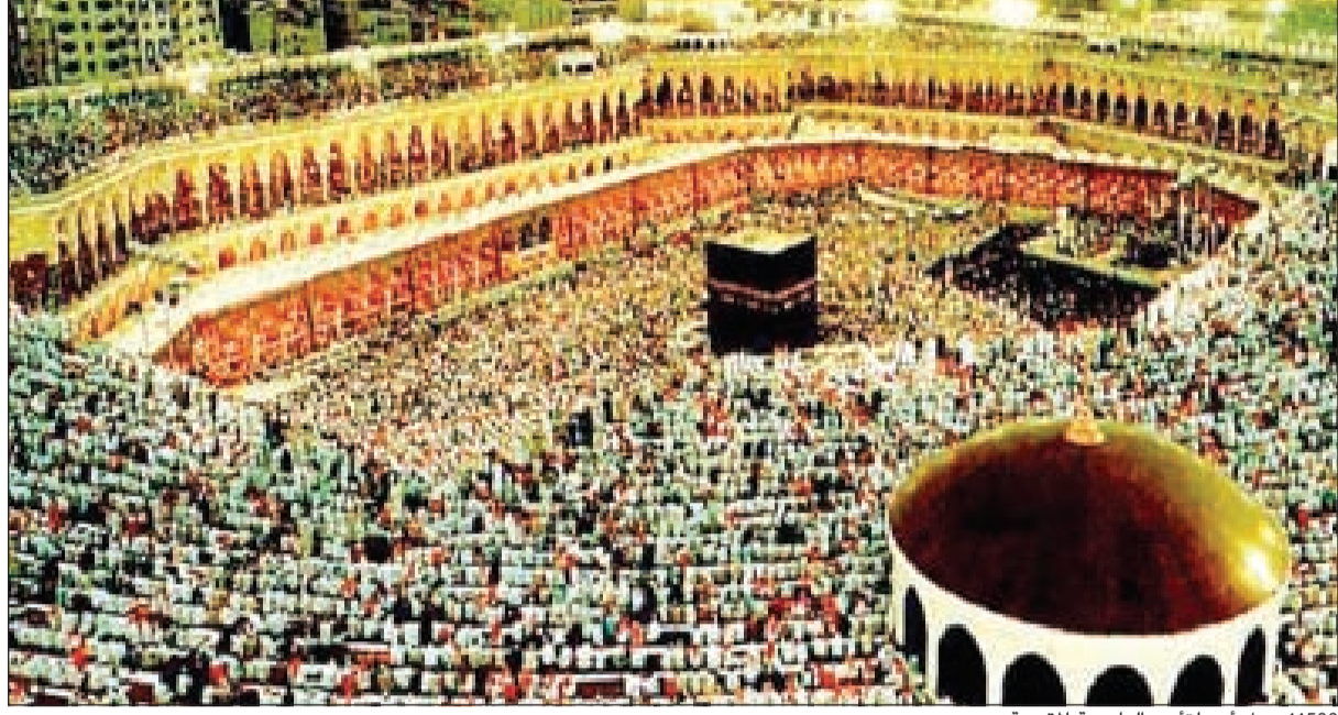
14500 رجل أمن لتأمين العاصمة المقدسة

إلى الجهة الشمالية حتى الباب 32، مشيراً إلى توليها مهام إدارة تنظيم الحشود في الساحات الشمالية الغربية وتنظيم الدخول قبل الصلوات، وتنظيم الخروج وتسهيل حركة المشاة من داخل الحرم حتى خروجها إلى الساحات الغربية الشمالية. وأكد قائد قوات الدعم بالعاصمة المقدسة والمشرف على الساحات الشمالية والغربية للمسجد الحرام أن جميع الاستعدادات بدأت منذ بداية شهر شعبان في التطبيق الميداني وجاهزية الخطط وجاهزية القوات بشكل عام، مشيراً إلى أن قوات الدعم وصلت في الوقت المحدد لها وبأشهرت مهامها، حيث يبلغ عدد قوات دعم العاصمة المقدسة 14 ألفاً و500 رجل أمن، إضافة إلى الأعداد السابقة في العاصمة المقدسة، وبذلك يكون إجمالي القوات 31 ألف رجل أمن لخدمة ضيوف الرحمن في المسجد الحرام والمنطقة المركزية والطرق المؤدية من وإلى المسجد الحرام.