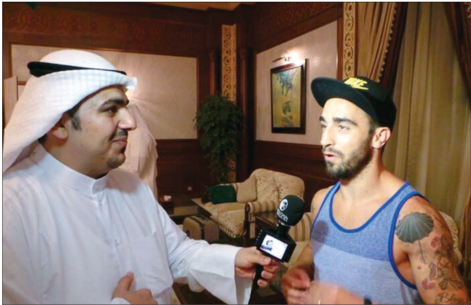
ريكاردينهو يتحدث لقناة الروضان بعد وصوله

من جانبه، أبدى النجم البرتغالي صاحب الـ 27 عاما سعاداته بالمشاركة في دورة الروضان للمرة الأولى والتي سمع عنها كثير من اللاعبين العالميين الذين شاركوا فيها من قبل، معتبرا الدورة تحديا خاصا امام كوكبة من أبرز نجوم اللعبة، حيث أبدى تحمسه للعب في الروضان والمنافسة على لقب الدورة، لافتا الى ان هذا الأمر يتوقف على مدى التفاهم والانسجام بينه وبين زملائه اللاعبين داخل الفريق. وكشف اللاعب الذي