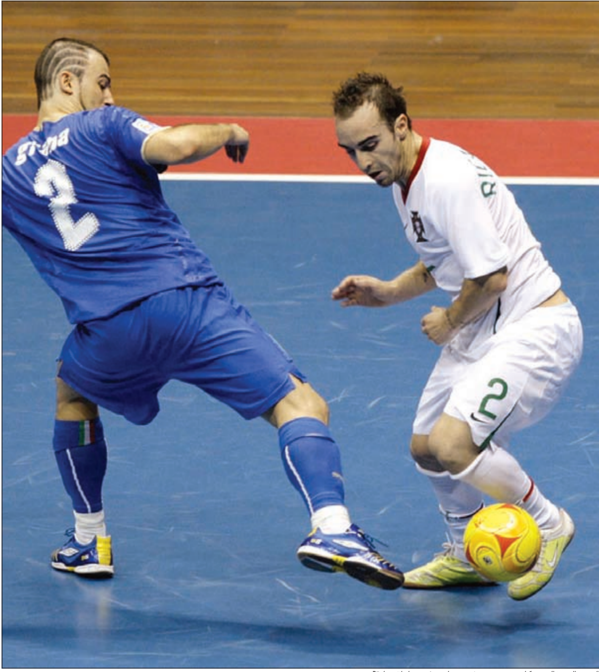
النجم البرتغالي ريكاردينهو يستخدم مهارته في مباراة سابقة