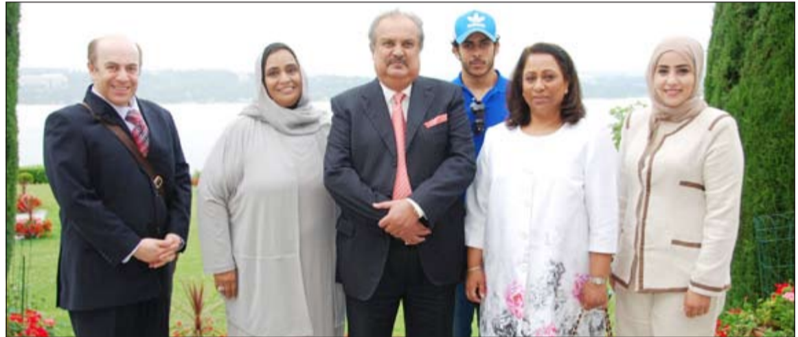
السفير ضرار رزوقي مع وفد الجهاز المركزي لتكنولوجيا المعلومات

أقام مندوب الكويت الدائم لدى الأمم المتحدة والمنظمات الدولية في جنيف السفير ضرار رزوقي مأدبة غداء بمنزله في جنيف لوزيرة الدولة لشؤون التخطيط والتنمية ووزيرة شؤون مجلس الأمة د.رولا دشتي والتي شاركت في حضور أعمال الجلسة رفيعة المستوى لأعمال مجلس الأمم المتحدة الاقتصادي والاجتماعي. حضر المأدبة سفير الكويت لدى الاتحاد السويسري د.سهيل شحيبير ومندوب الكويت الدائم لدى الأمم المتحدة السفير منصور العتيبي والمستشار والمستشار بوفد الكويت الدائم لدى الامم المتحدة في جنيف مالك الوزان، والمحقة الدبلوماسية بوفد الكويت الدائم لدى الامم المتحدة في جنيف رانيا المليفي والمحق التجاري ناصر البغلي والشخ جراح جابر الأحمد الصباح ووفد الجهاز المركزي لتكنولوجيا المعلومات.