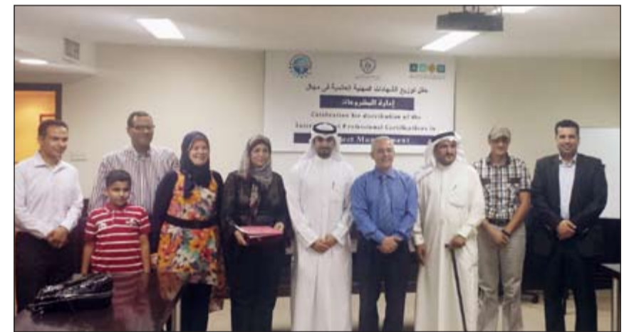
المؤهون للحصول على شهادة إدارة دولية في صورة جماعية

ومنها إدارة المشاريع والهندسة القيمة التي باتت ضرورية لكل المهندسين ومن كل التخصصات.