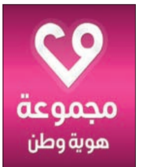
شعار مجموعة 29