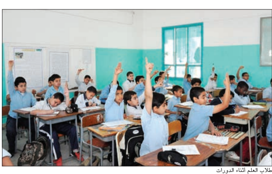
طلاب العلم أثناء الدورات

أيضا على كفالة الطلبة الأيتام في المدارس الأهلية ومساعدة الطلبة المعسرین، وحث المسلمين على فعل الخيرات والعمل الصالح. وأضافت اللجنة: ما أجلل وما أروع ان تشاهد طالبا أو طالبة قد حالت ظروفهم المادية دون استكمال مسيرتهم التعليمية، ونأتي نحن نيابة عن أهل الخير ونقدم لهؤلاء يد العون ونساعدهم في الانتظام في صفوفهم الدراسية ونحتهم على ان يكونوا نواة صالحة لمجتمع مسلم، لافتا إلى حرص اللجنة على تخريج جيل واع ومثقف من فئة الشباب المسلم، مضيفا ان العلم هو حجر الزاوية في الحفاظ على