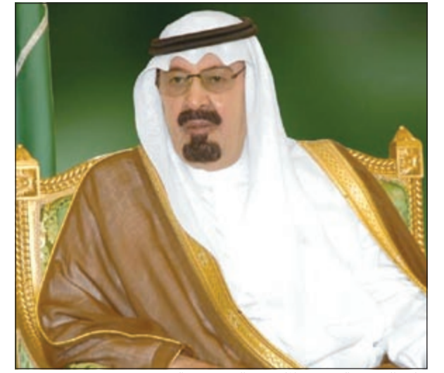
خادم الحرمين الشريفين الملك عبد الله بن عبد العزيز

البرنامج بناء على الدعوة المفتوحة قد تلقت أكثر من 3 آلاف دراسة مبدئية لمشروعات من الـ 14 دولة المطلة على البحر الأبيض وتم اختيار 19 مشروعا للتقدم الـ 14 دولة ومنها المشروعات الثلاثة بالإسكندرية. وأضاف عز «إننا قد تقدمنا لهذه المرحلة الأخيرة للبرنامج بـ 84 مشروعا تضمنت التعامل مع 150 من الشركاء في الدول الـ 14 المتوسطية للاتفاق على مكونات تلك المشروعات وتوزيع الأدوار والذي استغرق أكثر من 6 أشهر من العمل المتواصل بدعم من وزارة التعاون الدولي». وأشار إلى أنه سيتم تفعيل التعاون مع المشروعات الإقليمية والأوروبية لتنمية التعاون في كل مشروع من المشروعات الثمانية لتنمية التعاون الاقتصادي مع الاتحاد الأوروبي وهو الشريك التجاري والاستثماري والتكنولوجي والسياحي الأول بمصر.