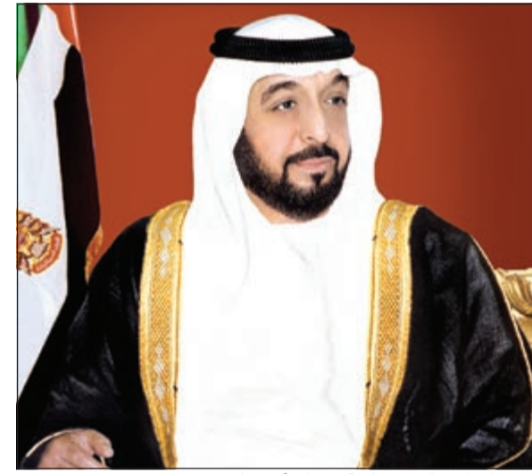
رئيس الإمارات الشيخ خليفة بن زايد آل نهيان