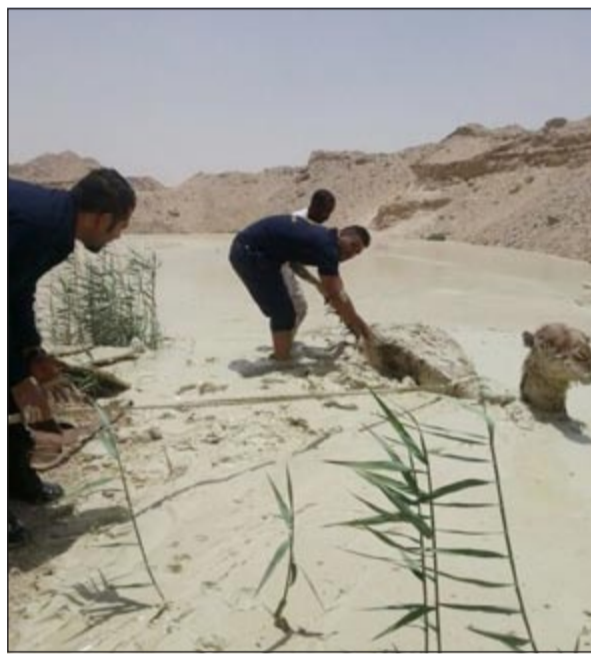
رجال مركز إطفاء الجهراء الحرفي خلال محاولات انتشال الناقة

وتحويلهم إلى الجهات المختصة. وحذر اللواء النواف من أن كل من يضبط من المتسولين وكفلائهم من الوافدين سوف يتم ترحيلهم وإبعادهم عن البلاد لمخالفتهم القوانين المعمول بها وتحاليلهم بالنصب وابتزاز الصائمين في الشهر الفضيل. وتطرق إلى استغلال بعض الوافدين لأذونات الزيارة في القيام بالتسول، مشيرا إلى ان وزارة الداخلية ستتخذ إجراءات صارمة تجاه هذه الفئة أو غيرها ممن يمتحن التسول ويتخذ منه مصدرا للدخل من دون وجه حق.