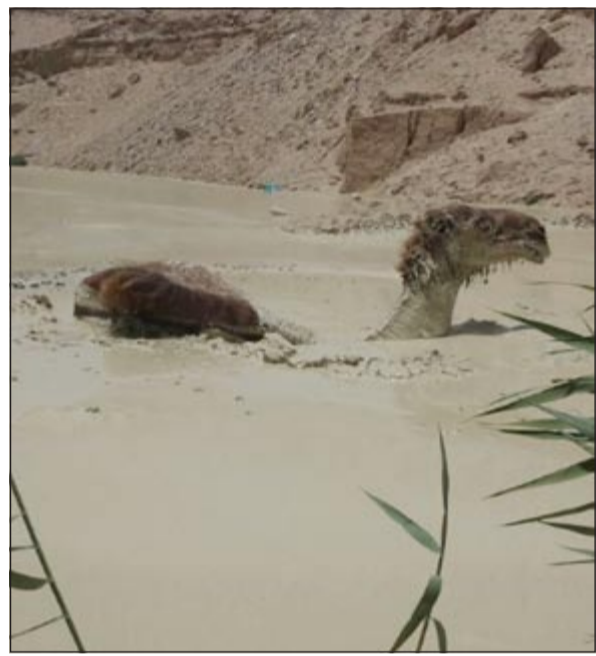
الناقة كما عثر عليها وسط البحيرة الطينية