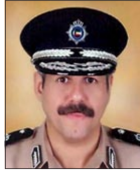
النواف فيصّل النواف

شدد وكيل وزارة الداخلية المساعد لشؤون الجنسية والجوازات اللواء الشيخ فيصل النواف على ان وزارة الداخلية ستتخذ إجراءات متشددة تجاه ظاهرة التسول وخاصة مع حلول شهر رمضان المبارك، حيث يقوم بعض الوافدين باستغلال الأجواء الروحانية للشهر الفضيل والتحايل على المواطنين والمقيمين للحصول على الأموال بدون وجه حق ودون الإحساس بحرمة شهر رمضان.