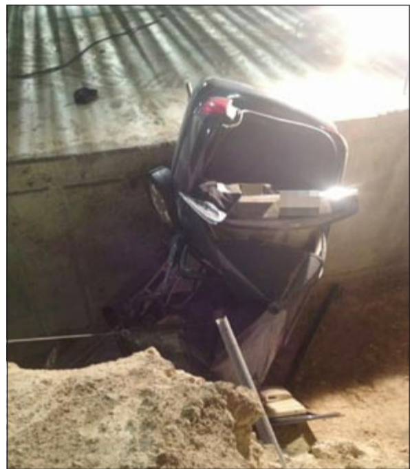
السيارة قبل انتشالها من الحفرة الإنشائية