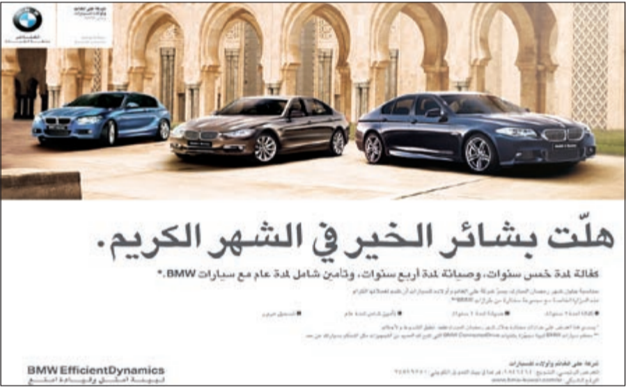
عروض علي الغانم وأولاده عند الشراء