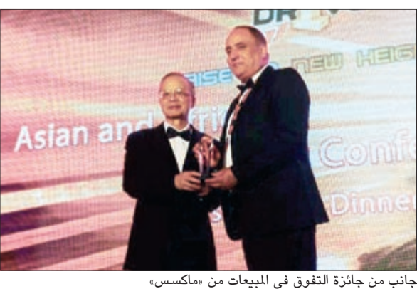
جانب من جائزة التفوق في المبيعات من «ماكسس»

حصلت شركة غلفيكس-البابطين على جائزة التفوق في المبيعات وخدمة العملاء لسنة 2012، وذلك في حفل كبير لموزعي إطارات ماكسس في آسيا وأمريكا، أقيم على جزيرة بانينج في ماليزيا. ويأتي هذا التكريم تقديراً من الشركة الأم لغلفيكس-البابطين لجهودها لتسويق إطارات ماكسس، حيث أصبحت من العلامات الرئيسية في الكويت التي أحرزت أعلى مستوى من رضا العملاء. ويظلم هذا الحدث سنوياً من قبل ماكسس تايران، حيث يتم وضع معايير عالية لجميع الموزعين فيما يتعلق بالمبيعات وخدمة ما بعد البيع ورضا العملاء. وتعرف غلفيكس-البابطين بامتلاكها علامات تجارية ذات نخب أول، حيث تؤمن بالجودة وخدمة ما بعد البيع ورضا العملاء. وبدوره قال المدير