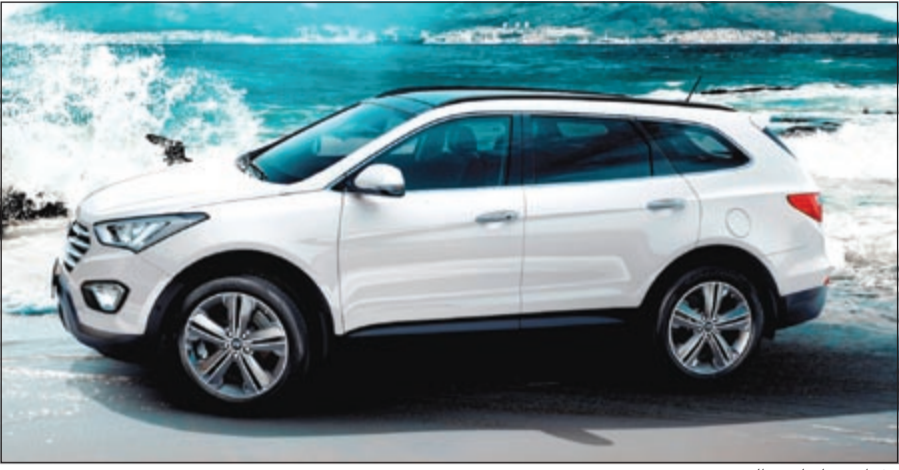
«غراند سانتافي» الجديدة