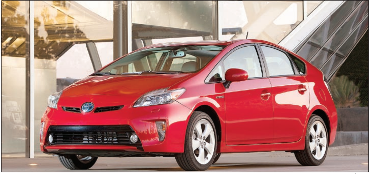
«تويوتا بريوس» تصميم رائع