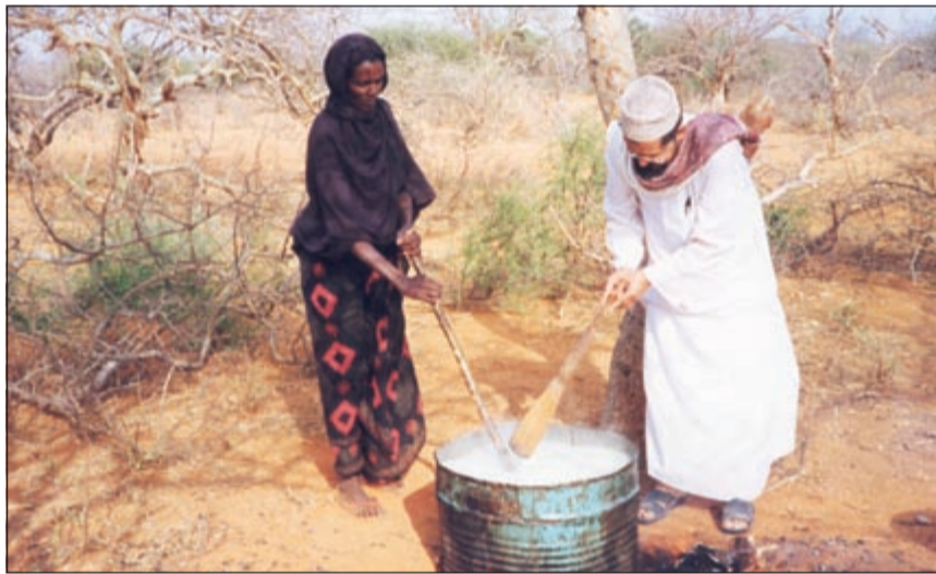
.. ويساعد امرأة

جعل اسرته تسير على طريقه وتنفهم دعوته وتساعدته على انجاز واجباته، فأحببت اسرته أفريقيا كما أحبها.