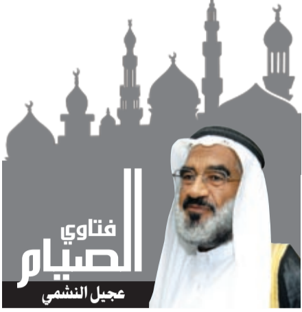
نذر الصوم طوال العمر

وأيديني فيه من ثومة الصائمين، وهب لي مثمرة فيه يا إله الصائمين، وأضف ضفي يا عسرا من الصائمين.