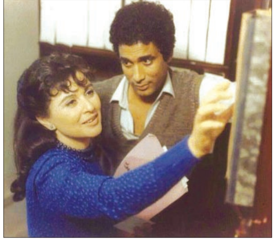
سعاد حسني مع أحمد زكي