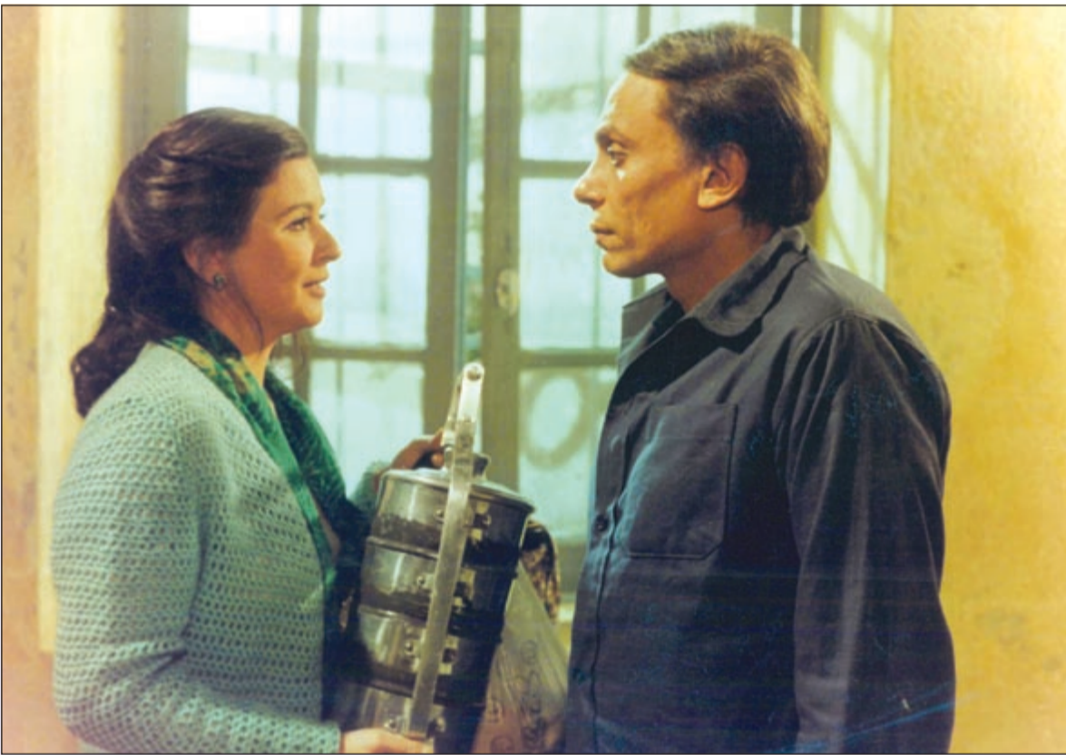
..مع عادل إمام

وفي جلسة المحكمة قدم محامي سعاد حسني اثباتا على ان موكلته لم تذهب الى موقع التصوير لأن المنتج قد أفلس، ولم يعد بمقدوره الإنفاق على الفيلم وبالتالي أخل بالالتزام بينما قدم محامي د.عيسى الدلائل على ان سعاد حسني تشاكس كل منتج، وان لها قضايا عديدة في هذا المجال. جرى هذا في ساحة المحاكم اما في جلسة المصالحة فقد اقترح المنتج جان خوري ان يحل محل د.عيسى في الفيلم فتردد الأخير كثيرا لأنه يريد ان يكمل الفيلم حسب رؤيته الخاصة فقال المخرج يوسف شاهين وكان حاضرا: نستطيع ان نعهد بالفيلم الى واحد من المخرجين الكبار امثال صلاح أبو سيف فقال د.عيسى: بل انت الذي تكمل اخراج الفيلم، فأنت الوحيد الذي أضع فيه نقتي كاملة، فوافق يوسف شاهين شرط ان تحل هذه الاشكالات والدعوى.