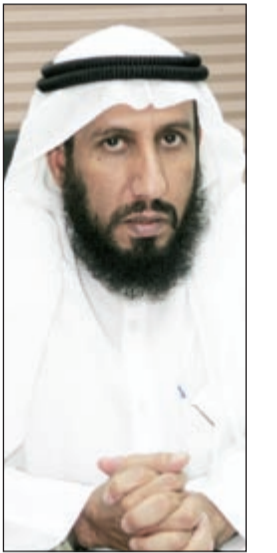
الداعية خالد الخراز