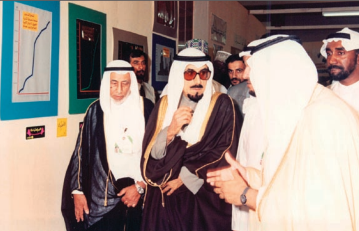
أمير البلاد الراحل الشيخ جابر الأحمد مع العم أبو يعقوب في المؤتمر الإسلامي العالمي

قمة التواضع وعلى لسان أبو مهند أيضاً يقول: إن العم بو يعقوب قمة في التواضع، حيث يحمل شئطته بيده ولا يرضى لأحد أن يحملها عنه أبداً حتى العامل الذي كان العم بو يعقوب يفاجئ، يحمل الشئط. كما أنه دقيق جدا في الوقت وعندما يحدد أي احتفال لابد من إقامته في وقتها بالساعة المحددة تماماً ويلتزم بالمواعيد ويقول: يجب على المسلم أن يقدر قيمة الوقت وإذا وعد المسلم لابد أن يوفي بوعده وهذا خلق إسلامي.