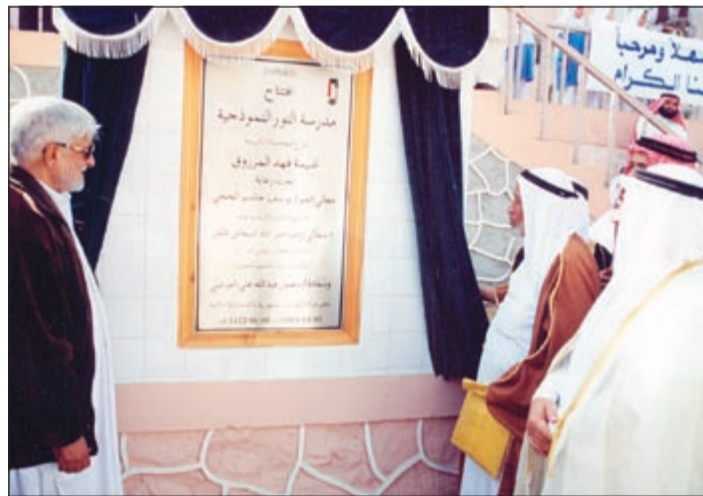
افتتاح مدرسة غنيمية المرزوق في منطقة كشمير