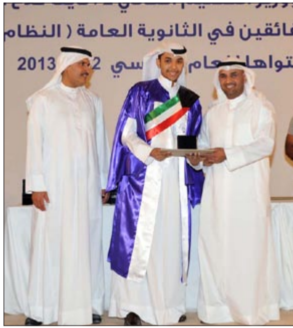
الحجرف والصقر يكرمان أحد متفوقي الثانوية