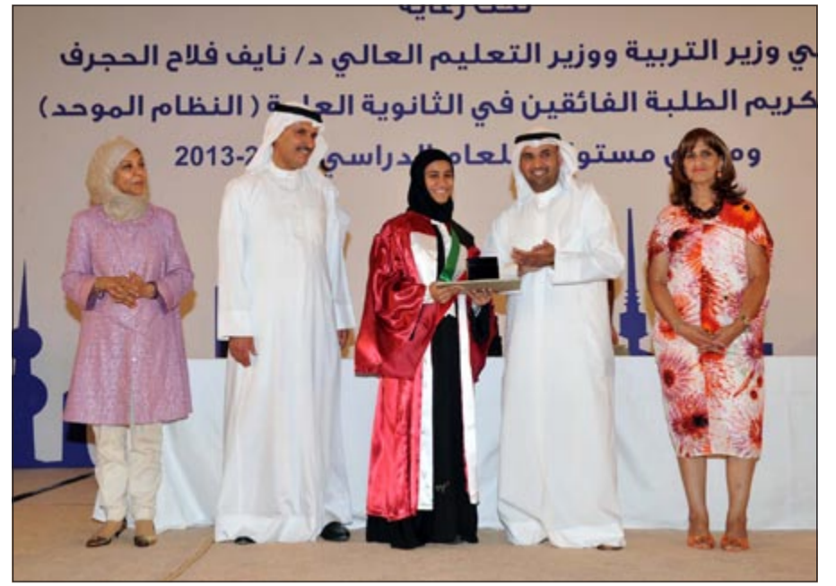
د. نايف الحجرف يكرم إحدى المتفوقات بحضور عصام الصقر

خلال تكريمه «121 طالبا وطالبة من متفوقي الثانوية» برعاية «الوطني» في فندق الجميرة