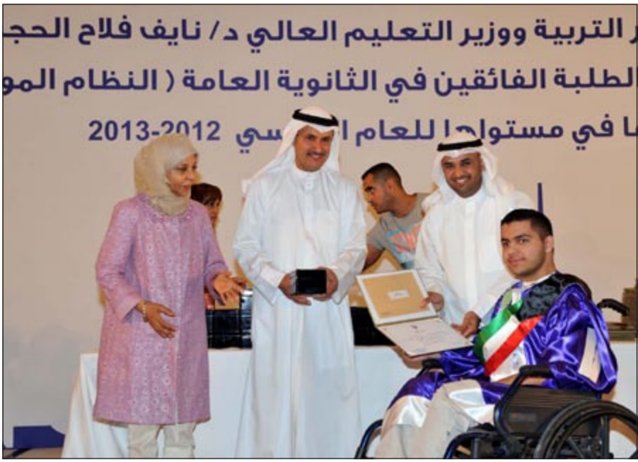
تكريم أحد الطلبة من فئة ذوي الاحتياجات الخاصة