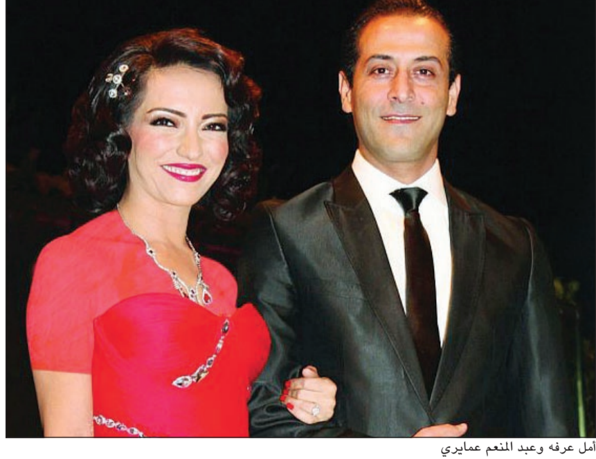
أمل عرفة وعبد المنعم عماديري

سجلت أمل عرفة ومعها عبد المنعم عماديري رقما قياسيا من الصعب تكراره في الوسط الفني العربي، هكذا فقد عادا سووية إلى عش الزوجية بعد ثلاثة أيام فقط على الانفصال في سابقة يستحقان عليها دخول موسوعة «غينيس» للأرقام القياسية. وعلى ما يبدو، فإن أمل تسرعت عندما أعلنت نيا الانفصال الذي فاجأ الجميع، خصوصا أن زواجهما يعتبر الأنجح في الدراما السورية منذ عقد قرانهما قبل 11 سنة، وقد توج بطولتين هما سلمى ومريم، وكنت أمل على صفحتها الخاصة على «فيسبوك»، بحسب ما ذكر موقع «انازهرة»: «11 سنة حب ورفقة وزواج واولاد، 11 سنة أقوى من محاولة انفصال باء بالفشل الذريع وما استمرت