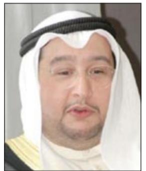
الشيخ دصباح جابر العلي

لدولة الكويت. وأضاف أن هذا المكتب أُنشئ خلال الـ 60 عاماً الماضية مدى كفاءة وحوكمة هذه المؤسسة الاقتصادية الحكومية، مؤكداً أن المكتب يتمتع بسعة عالية جداً عند المؤسسات المالية العالمية، وكذلك الصناديق السيادية في العالم، مشيراً إلى أن ذلك جاء نتيجة نجاح المساهمات الاستثمارية وتنوعها وتحقيق العائد المرجو منها.