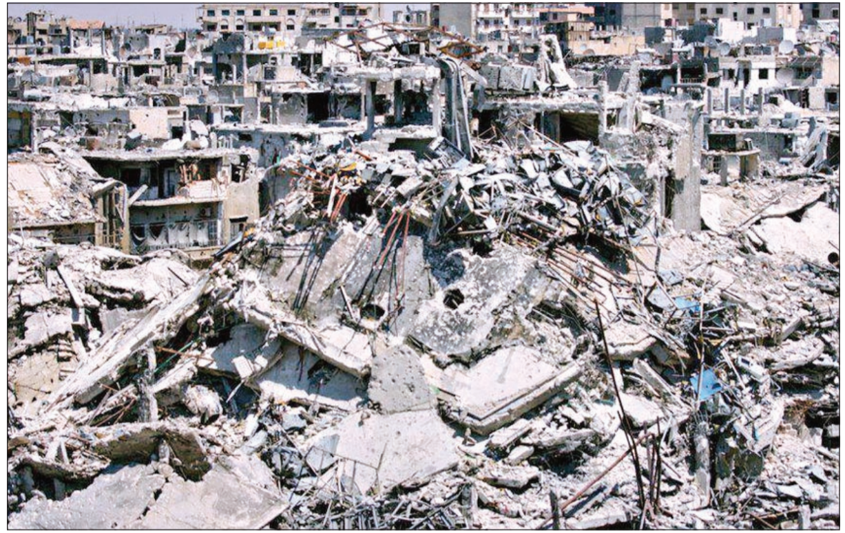
صورة وزعتها «تنسيقية حمص» للدمار الحاصل نتيجة قصف النظام لأحياء المحاصرة

وأضاف أن قتلى وجرحى وقصوا في صفوف القوات النظامية التي «قصفت بشك