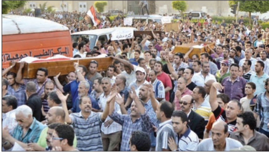
أهالي المنيل يشعرون ضحايا اشتباكاتهم مع عناصر مؤيدة للرئيس المصري المعزول محمد مرسي أول من أمس

القاهرة - وكالات: فيما عقد الرئيس المصري المؤقت عدلي منصور محادثات مع القائد العام للجيش ووزير الدفاع الفريق أول عبدالفتاح السيسي ووزير الداخلية محمد إبراهيم أمس عقب اشتباكات دامية أسفرت عن مقتل 36 شخصاً على الأقل وإصابة أكثر من 1400 آخرين بين مؤيدي مرسي ومعارضيه، أعلنت حركة «تسرده» على موقعها الرسمي على فيسبوك أن المدير العام السابق للوكالة الدولية للطاقة الذرية د.محمد البرادعي سيتولى رئاسة الحكومة المصرية الجديدة خلال المرحلة الانتقالية التي سيجري خلالها التحضير لانتخابات رئاسية، ووزير الداخلية السابق أحمد جمال الدين نائباً له للشؤون الأمنية.