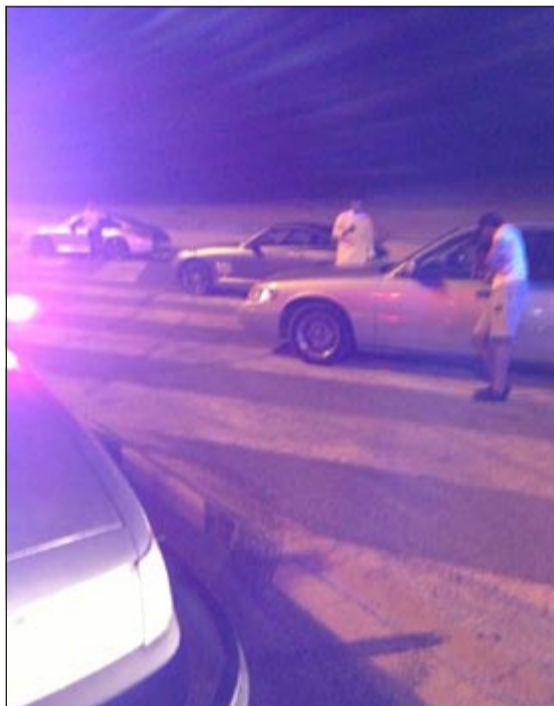
أمن الجهراء اوقف متسابقين في حملة أمس