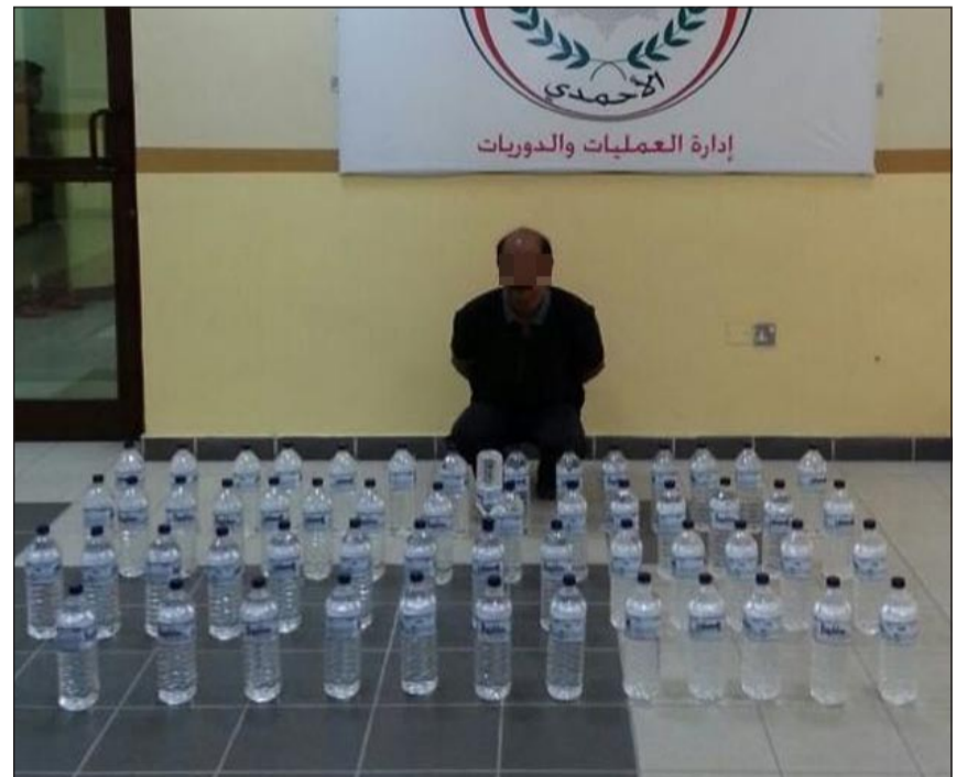
الاسيوي وامامه المضبوطات

عوض، وتم ضبط 20 مركبة كان قائدوها يجرون السباق بها، كما تم حجز 3 مركبات يستخدمها سائقوها في السباق ومعرضين حياة المارة الى الخطر. وفي تفاصيل الحملة التي انطلقت مساء الخميس وانتهت فجر الجمعة أفاد مصدر امني بأن الحملة توجه رجالها بتعليمات اللواء الطراح وتنفيذ المقدم سبيل والملازم اول طلال الرشيدى والملازم محمد