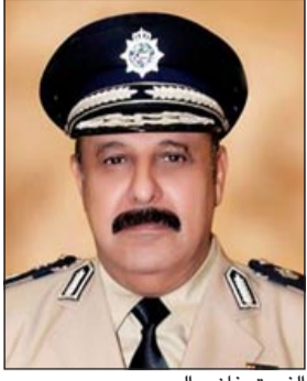
الفريق غازي العمر

لوزراء داخلية دول المجلس بناء على ما تم التوصل إليه خلال اجتماع وكلاء وزارات داخلية دول المجلس. وقد ضم الوفد المرافق لوكيل وزارة الداخلية في عضويته اللواء/عبد الحميد عبدالرحيم العوضي، واللواء د.عبدالله نواف العنزي، واللواء عصام سالم النهام، والعميد منصور محمود العوضي، والعقيد عادل أحمد الحشاش.