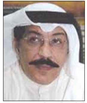
اللواء عبدالحميد العوضي