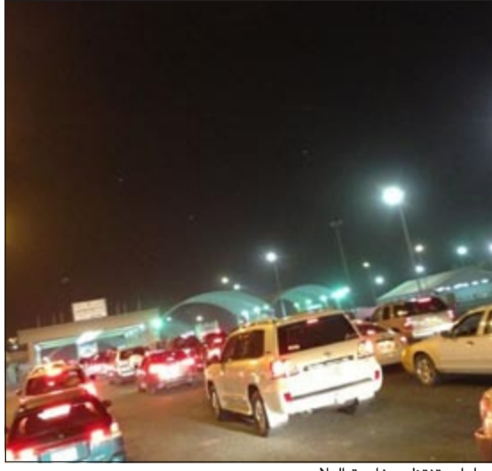
سيارات تنتظر مغادرة البلاد