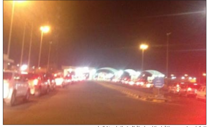
المركبات وتبدو مصطفة لمسافات طويلة اثر تعطل اجهزة الحاسوب

الحرارة عن أسفهم لاعتقاد تعطل أجهزة الحاسوب عن العمل، لاسيما في أيام العطلات.