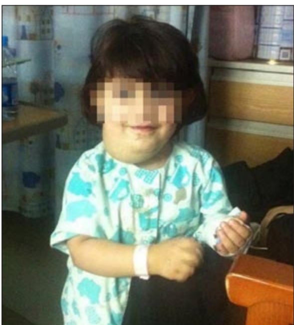
الطفلة انتظرت في المنفذ لساعات قبل السماح لها بدخول البلاد

في لفته انسانية صدرت تعليمات من قبل قيادات عليا في وزارة الداخلية بتمكين عودة أسرة من غير محددى الجنسية رغم انتهاء صلاحية جوازات سفرهم. وقال مصدر امني ان خبر وجود الأسرة البدون وصل الى رئيس مجلس الوزراء بالإنابة ووزير الداخلية الشيخ أحمد الحمود في تقرير تضمن ان الأسرة كانت تعالج طفلة لإصابتها بالسرطان في المملكة العربية السعودية وتحت وقع العلاج انتهت صلاحية جوازات سفرهم حيث أصدر الحمود وفي لفته انسانية تعليماته بتمكين الأسرة من الدخول الى البلاد وانجاز ما يلزم نحو تحديث جوازات سفرهم للظروف الصحية التي دفعتهم الى المخالفة.