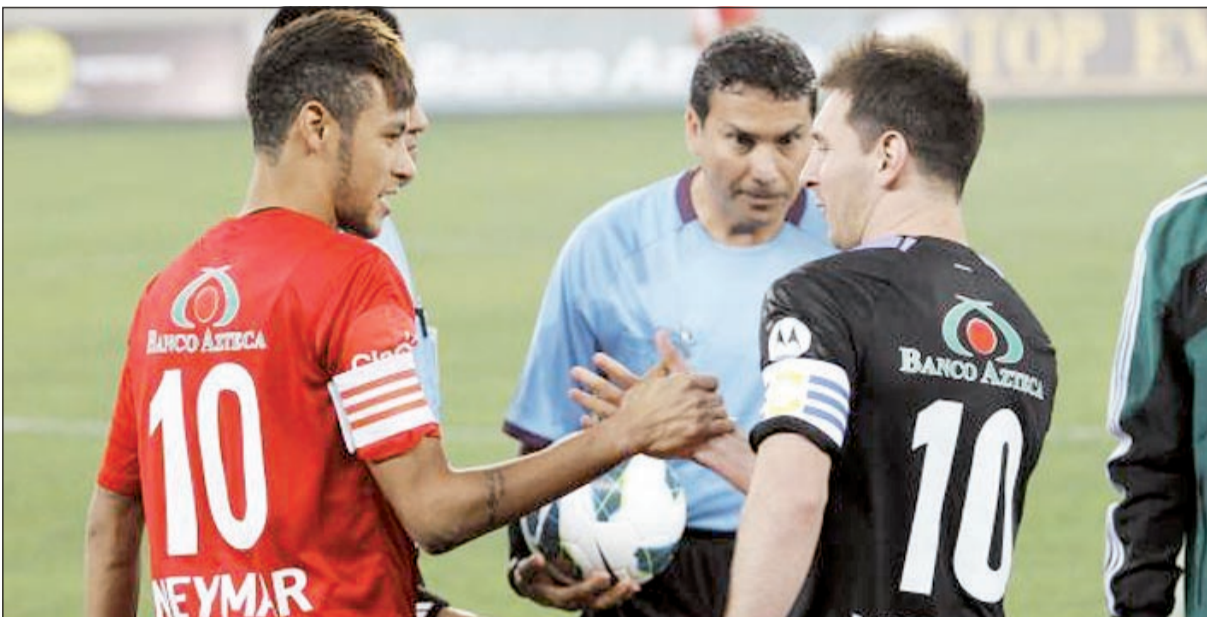
ميسي ونيمار ثنائي ممتع في برشلونة يترقبه الكثيرون