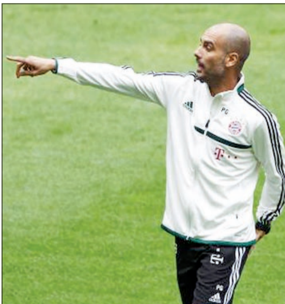
مدرب بايرن ميونخ جوسيب غوارديولا يشيد بميسي ونيمار

المحلي إلى النطاق القاري.. وأضاف غوارديولا «أيضا لديهم العديد من مصادر الدخل بعد بنائهم لمعهم الخاص بالإضافة إلى جمهور مشتاق للانصارات». واختتم المدرب الإسباني حديثه قائلاً «المدرب لاغزيتا ديلو سبورت «في دوري أبطال أوروبا الموسم المقبل أخشى يوفنتوس كثيرا، فالفريق به الكثير من الأبطال ووضوح لديهم عزيمته نقل التفوق لا يعرف الاستسلام أبدا».