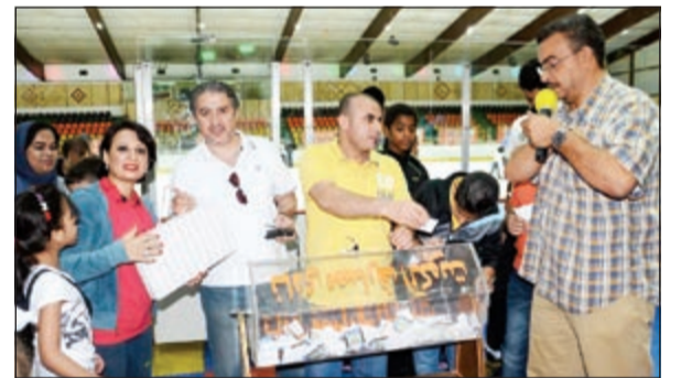
إعلان أسماء الفائزين

نظم نادي مصارف الكويت أمسية ترفيهية لموظفي المصارف وأسرهم في صالة التزلج أحد مرافق شركة