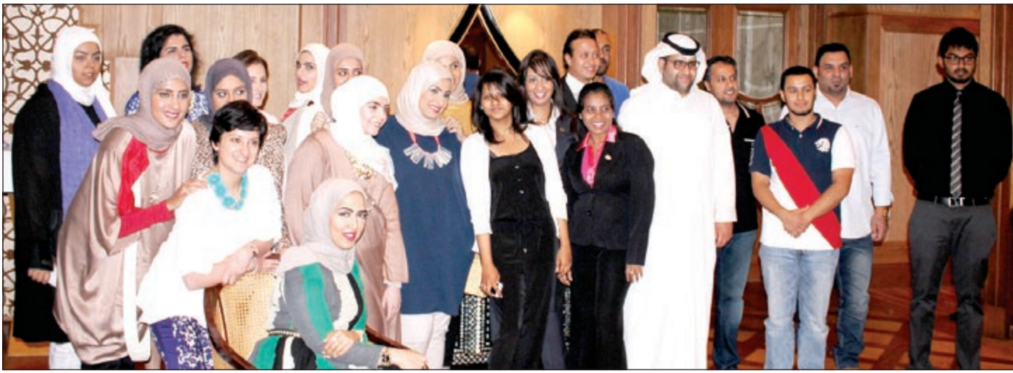
لقطة تذكارية للمدونين في احتفال «قريش المدونين» بالريجندسي