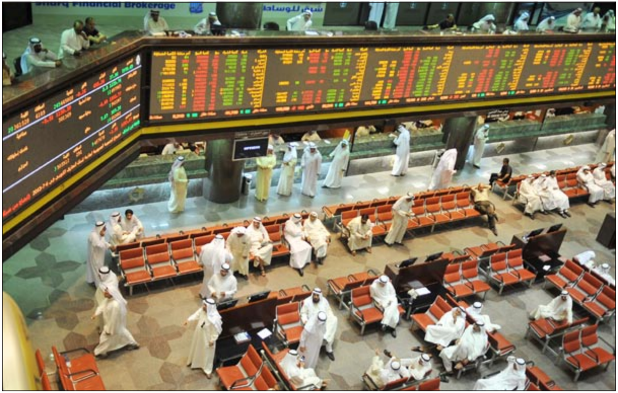
عمليات شراء مضاربية تدفع السوق للارتفاع

أنهى سوق الكويت للاوراق المالية تعاملات الاسبوع على تحقيق ارتفاع على مستوى جميع مؤشراتاته وذلك لليوم الثاني على التوالي جراء عمليات دخول على بعض الاسهم سواء القيادية او الرخيصة في اغلب القطاعات، الامر الذي انعكس على اداء المؤشرات بشكل ايجابي، خاصة المؤشر العام الذي اقترب مجددا من استعادة مستوى 8000 نقطة. ووضح من خلال التعاملات ان السوق لا يزال يعتمد بشكل اساسي في الجلسات الاخيرة على الاسهم الرخيصة التي تستقطب السيولة بشكل لافت، خاصة اسهم مثل تمويل الخليج وهيتس والمنتجات والامان، الامر الذي يعكس التوجه المضاربي السائد حاليا في السوق.