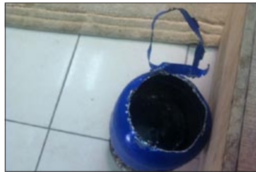
السلندر بعد تفريغه