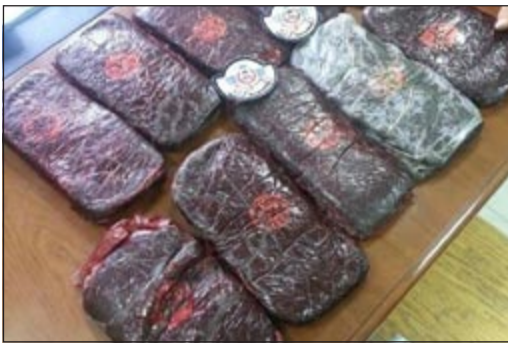
محتويات 10 كيلو حشيش

الكمية وإجراء تحريات بشأن من جلبها معه. وقال مصدر جمركي ان رجال منفذ العبدلي رصدوا سلندر غاز ملقى في منطقة من قبل المنطقة الجمركية، وعليه تم استدعاء إدارة الأثر وتبين ان السلندر به