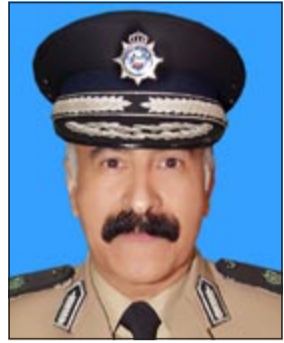
الفريق متقاعد عبدالله الراشد

حيث نقل اليه تقدير القيادة السياسية العليا للبلاد على ما قدمه من عطاء وجهه من أجل دعم العمل الأمني وتعزيز امان مواطنيه خلال مشواره المهني في الوزارة.