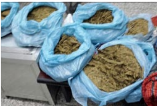
الضبوطات من الماراغوانا

صباح امس وبتفتيش امتهنت عثر رجال الجمارك على الماراغوانا وقد اخفاها بطريقة مبركة في امتهنت، وأشار الفهد الى ان الوافد ويعمل سابقا اقر بأنه جلب المواد المخدرة بقصد الاتجار،