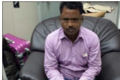
الاسيوي بعد ضبطه في مطار الكويت

أحال مراقب عام جمارك مطار الكويت الدولي سليمان الفهد وافدا بنغاليا الى الإدارة العامة لمكافحة المخدرات لاتهامه بجلب 10 كيلوغرامات من مادة الماراغوانا المخدرة، وقال الفهد في تصريح لـ«الأنباء» ان أحد المفتشين اشتبه في وافد بنغالي قدم من وطنه