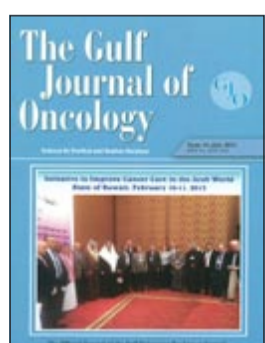
غلاف مجلة الخليج للأورام

في المنطقة العربية والخليج وبقيّة دول العالم، ذاكراً أن للمجلة رصداً مرتفعاً في المكتبة الأميركية وقد ساهمت خلال الأربع سنوات في نشر الكثير من البحوث العلمية ذات العلاقة بالأورام السرطانية في دول الخليج، وأصبحت ذات سمعة دولية ويظهر مقدار انتشارها على المستوى الدولي من اعداد البحوث التي قدمت للنشر بهذه المجلة من عدد كبير من دول العالم، علماً أن هذه المجلة البحثية تنشر على صفحة الاتحاد الخليجي لمكافحة السرطان الالكترونية www.gffcc.org ويمكن للباحثين تقديم بحوثهم إلكترونياً عبر www.gffcc.org/journal ويقوم ما يقارب المائة محكم في هذه المجلة من دول الخليج والدول العربية ودول العالم المختلفة بتحكيم هذه البحوث والرد على مقدميها.