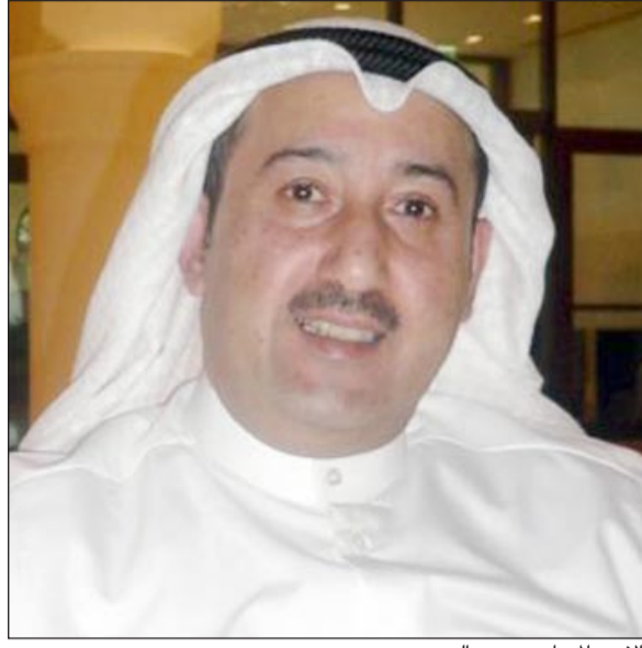
الأمين المساعد محمد العسكوسي