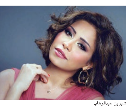
شيرين عبد الوهاب

الفترة الحالية بسبب كثرة حديث المجلات عن عودتها لبعضها. وأضافت: «ساعات في أوقات كثير يقولوني يا حبيبتي وأنا بقولها بس طعم الكلمة اتغير، وبت أقصد بها أن محمد هو اللي بيتاعي لأنه رجل العائلة». أما عن سر ارتداء شيرين لدبلة زواج فقالت: «هذه الدبلة سرها أنني كنت في دبي وأعجبت بها وقلت بشرائها ولبستها للنفسى»، وتضحك