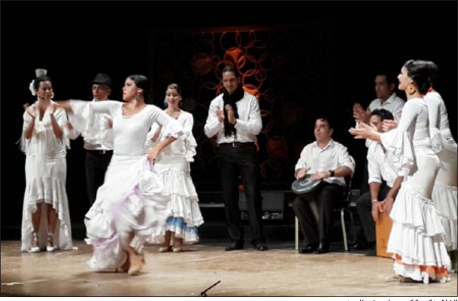
الفلامنكو الكوبي ادمش الحضور