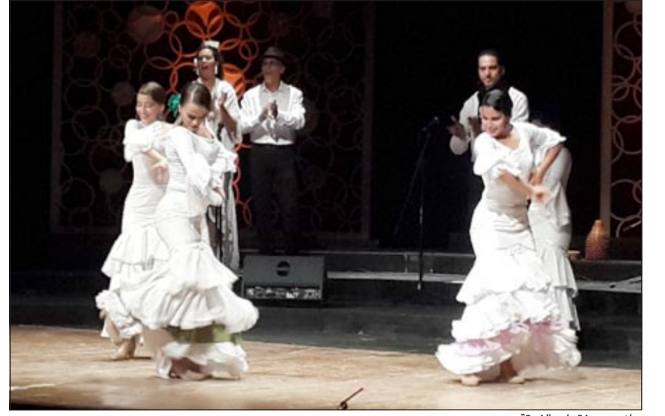
جانبا من فقرات الفرقة

فنون هذه الفرقة إلى الأندلس (إسبانيا) التي أدت دورا كبيرا في الحفاظ على فن الفلامنكو في كوبا.