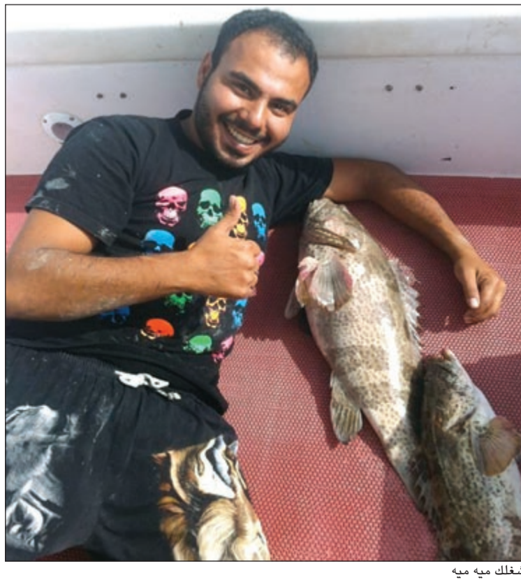
شغلك ميه ميه

ما الأماكن المناسبة للصيد؟ ● شوف طوال فترة خبرتي البحرية وجدت ان بحرنا وصيدنا وأسماكنا تغيرت وذلك لعدة أسباب أهمها التلوث الحاصل وكثرة الطاريد وأصحاب المشايك والقراقرير فكل هذه الأمور أثرت بشكل كبير على الصيد والحداق ولو تأتي ونسال أي طراد عائد إلى المستنة عن حال البحر والصيد تجد الإجابة سلبية وهذا ما يحزنك بالبحر فعلاً يا أخي أصبح الواحد يدخل البحر ليلتمتع بالصيد ويرجع بإيدامه ولكنه يفاجأ بنسج الصيد وقلة الأسماك ولا يجد سوى العلب الفارغة الطافحة