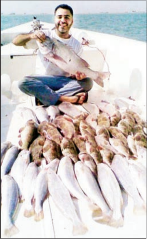
صيد متنوع بإحدى الرحلات