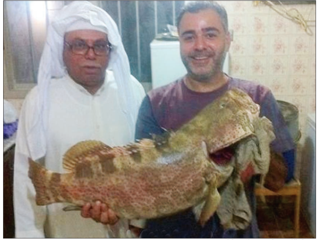
وحيد الفيلاكارى مع والده وصيده المفضل الهامور