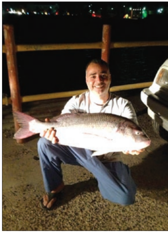
فعلنا الخبرة تلعب دور

نصيحة أخيرة لك؟ ● نصيحتي الأخيرة أقولها لإخواني الحداقة أنكروا الله في الرخاء يذكركم بالشدة وحافظوا على الإسعافات الأولية كاملة ولا ينقص منها شيئاً وأهم شيء اللايف جاكيت وفي الختام أدعو للجميع بالصيد والسلامة.