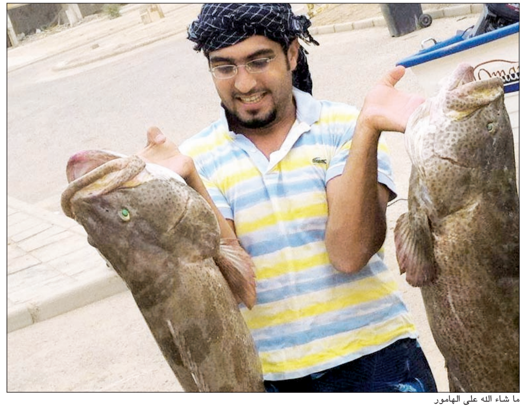
ما شاء الله على الهامور