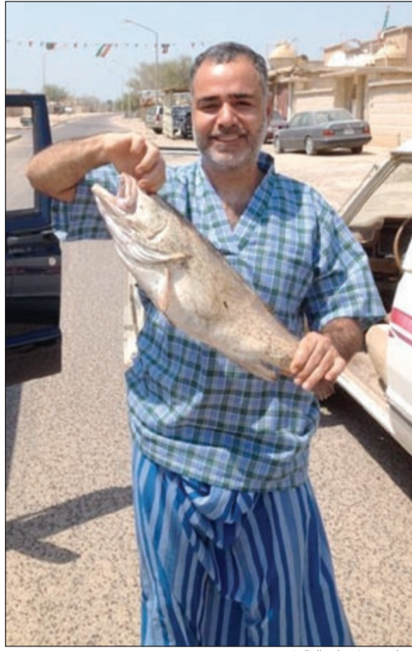
تسلم يمينك على البالول