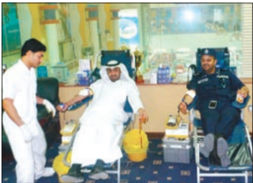
جانب من حملة التبرع بالدم