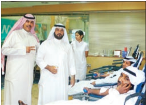
أعضاء «تعاونية الصليبية» يتبرعون بدمائهم

ضمن الأنشطة والفعاليات الاجتماعية التي تقيمها جمعية الصليبية التعاونية خدمة منها للمساهمين وأهالي المنطقة والمؤسسات المحلية كقيادة المنطقة «الاستقلال» والمدارس. فقد تم تنظيم حملة للتبرع بالدم في يوم الاثنين الماضي، بالتعاون مع بنك الدم المركزي، حيث قامت الجمعية بتوفير المكان المخصص لاستقبال المتبرعين وتوفير كل ما يتعلق بالعمليات الخاصة بهذه الحملة.