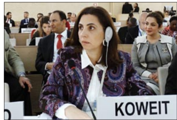
د. رولا دشتي خلال الاجتماع

جنيف - كونا: قالت وزيرة الدولة لشؤون التخطيط والتنمية ووزيرة الدولة لشؤون مجلس الامة د. رولا دشتي أمام مجلس الام المتحدة الاقتصادي والاجتماعي «ان الأزمات الاقتصادية والاجتماعية والبيئية المتزايدة توحى بأن العالم سيشهد استمراراً في الاضطرابات خلال السنوات المقبلة».