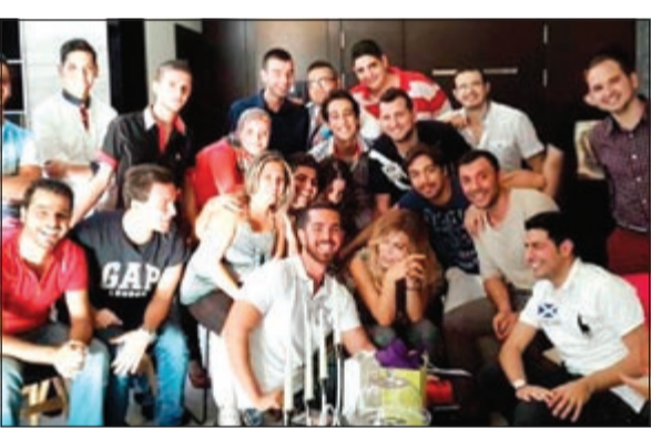
نوال الزغبى مع معجبيها في منزلها

الجوائز التي حصلت عليها خلال مسيرتها، إلا أن وجود جمهورها بجانبها هو أعلى هدية والأقرب إلى قلبها.