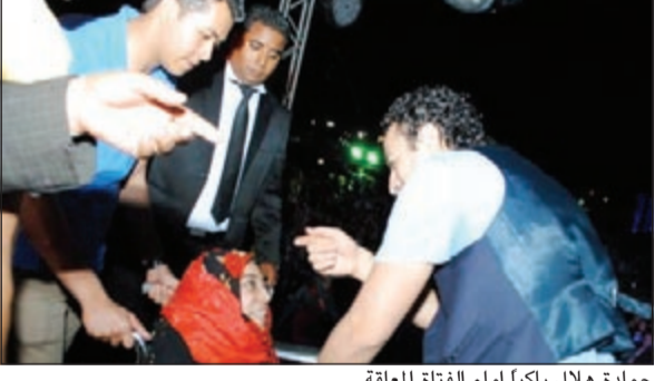
حمادة هلال باكيا أمام الفتاة المعاققة

لحمادة هلال. وفي نهاية الحفل كرمت إدارة المدرسة المطرب حمادة هلال، ومنحته، حسب موقع «جولوسي»، درعا تقديرية عرفانا لمشاركته في الاحتفال بهذا اليوم المميز.