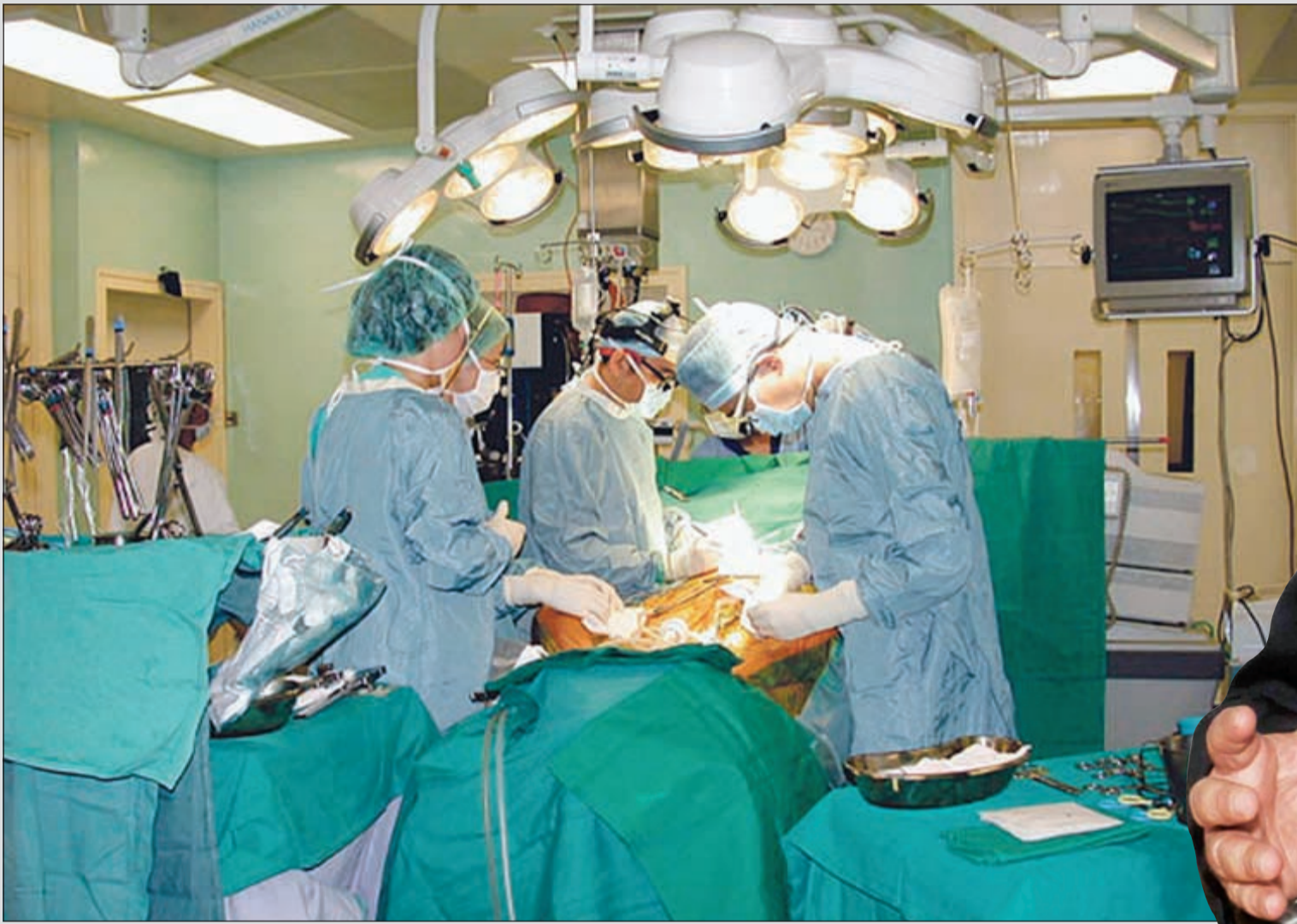
عملية القلب المفتوح تطلق على عملية تبديل صمامات القلب