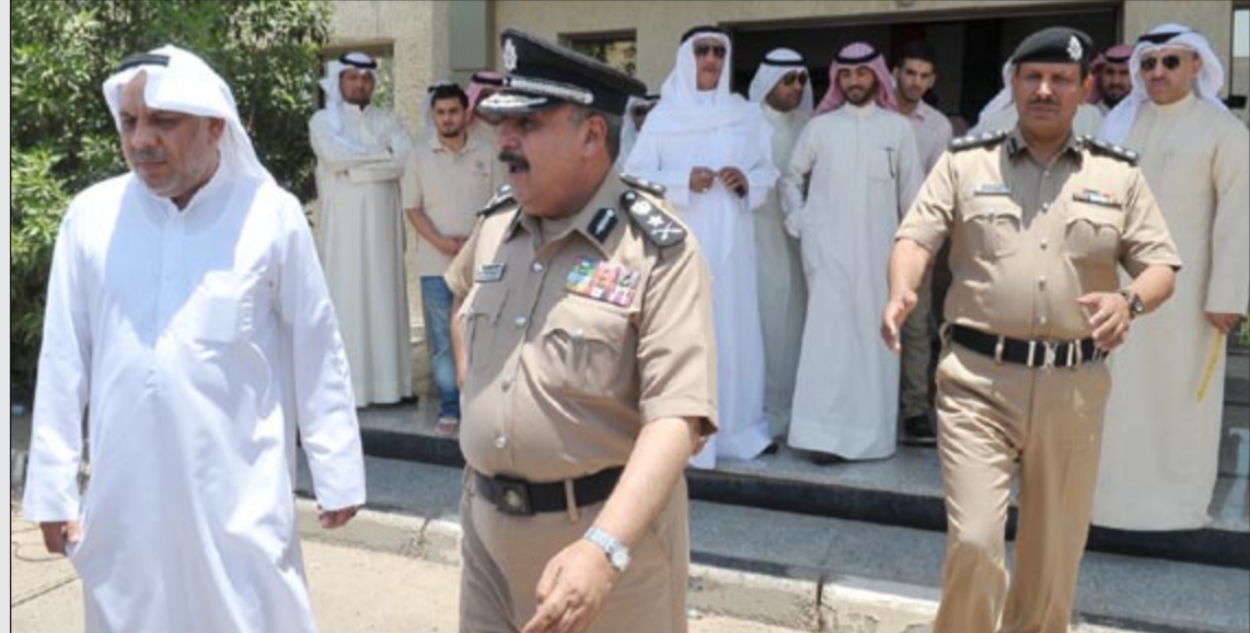
الفريق غازي العمر يتفقد إدارة الانتخابات ويجواره مدير الإدارة علي مراد

على ضرورة تيسير الإجراءات على المرشحين والمرشحات، مشيرا الى ان وزارة الداخلية منوطه بفتح باب قبول طلبات الترشيح وفقا للقانون، مؤكدا على ان قيادات ورجال وزارة الداخلية يبذلون أقصى ما في وسعهم لتوفير جميع الخدمات وتيسير الامكانيات والتسهيلات للمرشحين والمرشحات في اطار الاستعدادات المكثفة لجميع اجهزة الوزارة لاتمام العملية الانتخابية بكل مراحلها على الوجه الاكمل وبأسلوب حضاري وتعامل راق وفقا لقواعد القانون واللوائح المنظمة للعرس الديمقراطي باعتبارهم درعا للوطن ومصدر الامن والامان