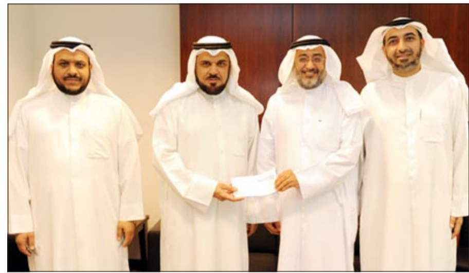
ممثلو شركة ميديكا خلال تقديم التبرع

وأشاروا إلى أن مجموعة الامتياز للاستثمار وشركاتها التابعة حرصت طوال السنوات الماضية على تدعيم أوضاع التعاون مع بيت الزكاة لمعاونته على أداء رسالته السامية من خلال دعم مشاريعه الخيرية المتنوعة، ما يعكس دور المجموعة في خدمة الوطن والمواطنين والمساهمة في دفع مسيرة الخير والتقدم في الكويت. من جهته، أعرب وفد بيت الزكاة عن شكره وتقديره للبالغين لشركة «أي ميديكا للرعاية الصحية» ومجموعة