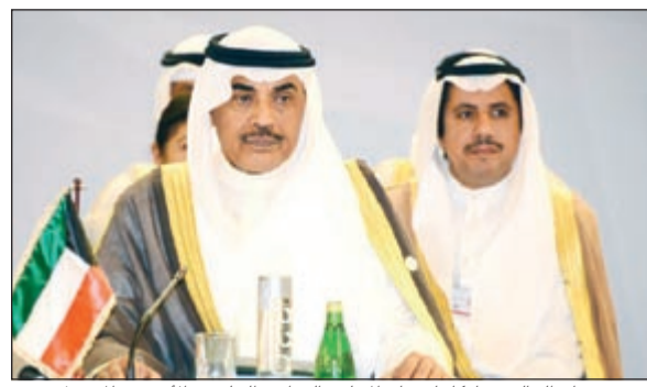
الشيخ صباح الخالد مشاركاً باجتماع المجلس الوزاري الخليجي الأوروبي المشترك

مجدداً رفض كل ما يؤدي إلى تجزئته والتدخل في شؤونه الداخلية والحفاظ على هويته العربية والإسلامية. ودعا الخالد في كلمة في اجتماع (الدورة الـ 23 للمجلس الوزاري المشترك بين دول مجلس التعاون والاتحاد الأوروبي) أمس إلى الحث على الحوار والتوافق والمشاركة بين مكونات الشعب العراقي بما يؤدي إلى حفظ واستقرار العراق ووحدة. ودان في كلمته حوادث التفجيرات المتكررة في المدن العراقية التي تستهدف المدنيين والأبرياء والهيئات والمؤسسات الحكومية العراقية. ورحب بتعاون العراق في تنفيذ قرارات مجلس الأمن ذات الصلة وخاصة الانتهاء من صيانة العلامات الحدودية وفقاً لقرارات مجلس الأمن والتوقيع على مذكرة التفاهم بشأن ترتيبات عملية صيانة التعيين المسادي للحدود مع الكويت.