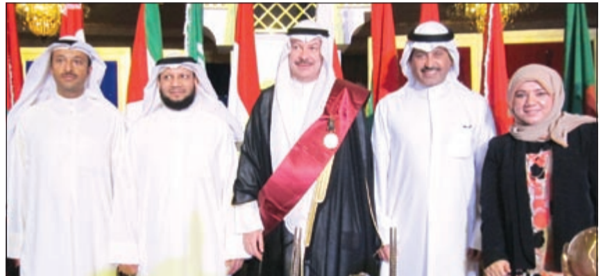
مدير عام الجهاز المركزي لتكنولوجيا المعلومات بدولة الكويت عبد اللطيف السريع يتوسط مسؤولي جهات حكومية كويتية فائزة بجوائز درع الحكومة الإلكترونية ضمن جوائز أكاديمية (تويج) لجوائز التميز في المنطقة العربية

أعلن الجهاز المركزي لتكنولوجيا المعلومات انه قد تم تنويع عبد اللطيف السريع مدير عام الجهاز المركزي لتكنولوجيا المعلومات بمنحه وسام الاستحقاق الإداري في مجال القيادة الحكيمة عن فئة قيادات الحكومات الإلكترونية العربية تقديراً لدوره وجهوده في تحقيق الإنجازات المتميزة التي تمت في تنفيذ مشروعات الحكومة الإلكترونية، وتقديراً للتقدم الذي أحرزته الكويت في تنفيذ مشروعات منظومة الحكومة الإلكترونية من خلال