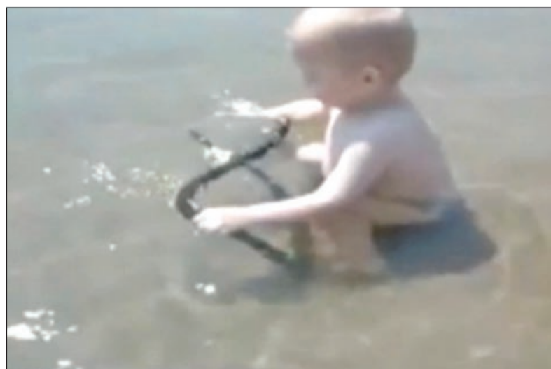
الطفل يلعب بالأفعى السامة

ويصل طول الأفعى النحاسية الرأس أو الكوبر هيد أو أفعى «الماء السامة»، كبيرة من الحيوانات، بما في ذلك الضفادع والأسماك والثدييات من الحيوانات والطيور، كما أنها تلد صغارها في فصل الصيف.